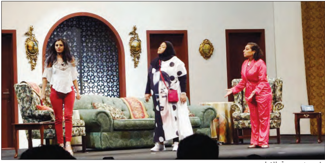
مشهد من مسرحية «المزواجي»