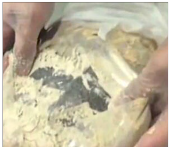
الإثيوبية أخفت القات في لفافة أطعمة