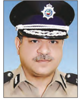
اللواء جمال الصايغ

أحيلت قضية حملت رقم 2016/215 إلى النيابة العامة للوقوف على كامل الحقيقة، وذلك على خلفية أحداث هي الأقرب في تفاصيلها لما نشاهده في أفلام الأكشن الأميركية. وتعلقت القضية بهروب شاب كويتي من رجال الأمن ورفضه الامتثال لتعليمات رجال الأمن على الشروع في دهس رجل أمن، أما والده