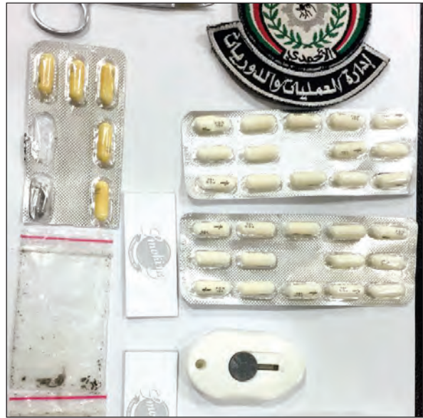
المضبوطات تنوعت بين حبوب ودوات تعاط