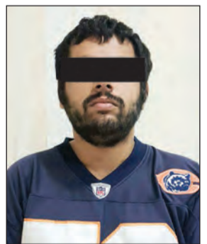
المتهم بعد القبض عليه

الإلكترونية التابعة للإدارة العامة للمباحث الجنائية تابعت الواقعة واتخذت الإجراءات القانونية للتوصل لمن قام بنشر الإعلان بعد أن حدد لها سعراً على صفحة السوق المفتوح الإلكتروني، وبعد البحث والتحري تم ضبط صاحب الإعلان الذي أقر بأنه ارتكب الواقعة، مدعياً أن لديه مركبة مشابهة لها يريد بيعها، وقد أحيل المتهم إلى جهات الاختصاص لاتخاذ الإجراءات المناسبة بحقه.