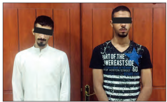
الضمان بعد القبض عليهما