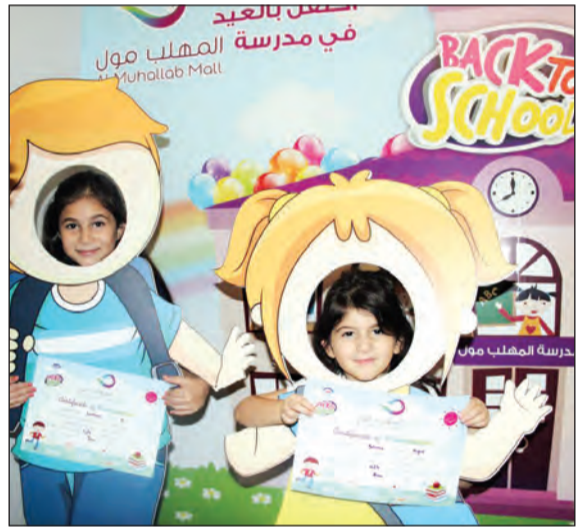
شهادات للأطفال بعد المشاركة في الأنشطة