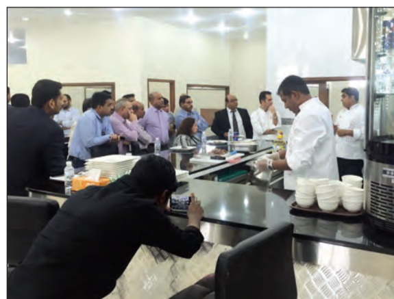
متابعة من الحضور لإعداد الطعام