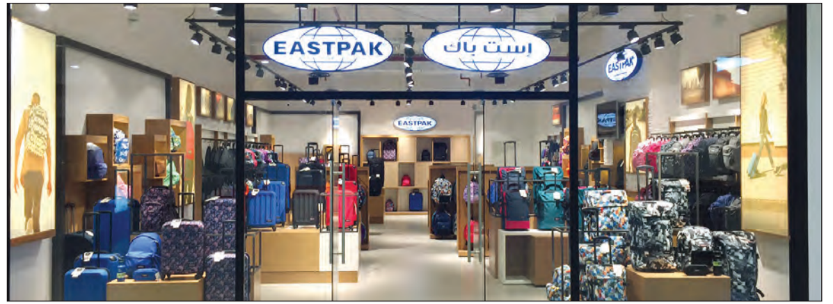
متجر «إيست باك»

الوهاب المطوع التجارية هي شركة رائدة في مبيعات التجزئة والجملة وواحدة من أعرق الشركات التجارية الكويتية، والتي بدأ نشاطها التجاري منذ أكثر من 80 عاماً. تبنيت خلالها سياسة التوسع لتصبح وكيلاً لأكثر من 100 علامة تجارية عالمية مميزة. وتوفر الشركة منتجات «إيست باك» في الكويت بشكل حصري منذ أكثر من عشر سنوات، وتوزع مجموعة واسعة من الحقائب مباشرة إلى السوق. كما تتوافر منتجات «إيست باك» في الكويت لدى محلات «كاربون فاير» الواقعة في مجمع الأقبليوز، ومجمع الأنفال، ومطار الكويت الدولي، ومن الآن فصاعداً تتوافر بمتجر مستقل في الدور الأرضي من مجمع البوليفارد في السالمية.