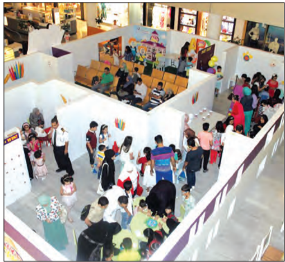
عدد كبير من المشاركين

والتي تراوحت بين 100 و1000 نقطة. واشتملت حملة «المهلب مول» العام، منها: البوليفينغ، وألعاب الذاكرة، وصيد السمك، وكرة السلة وغيرها، كل منها تمنح الأطفال 100 نقطة حسب المجهود الذي يقدمونه خلالها. وتهدف هوية العلامة التجارية للمهلب مول الذي تم تجديده مؤخراً، وتحديث إستراتيجيته المجمع ككل، لتعزيز التواصل مع الجمهور، من خلال الأنشطة والفعاليات الشهرية، التي تم تصميمها خصيصاً لتلبية احتياجات كافة شرائح المجتمع.