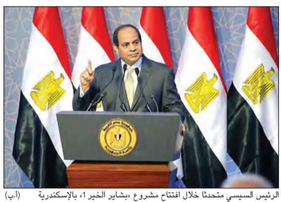
الرئيس السيسي يتحدث خلال افتتاح مشروع «بشائر الخير 1» بالإسكندرية

وقال السياسي، خلال افتتاح مشروع «بشائر الخير 1» بالإسكندرية، إن مصر حققت خطوات كبيرة ونجاحات شاملة في مكافحة الإرهاب، محذرا من محاولات زعزعة الاستقرار والثقة في القيادة والدولة. وشدد على أنه لن يستطيع أحد أن يمس الدولة المصرية أو الشعب المصري، مضيفا أن هناك خططا جاهزة لانتشار الجيش في