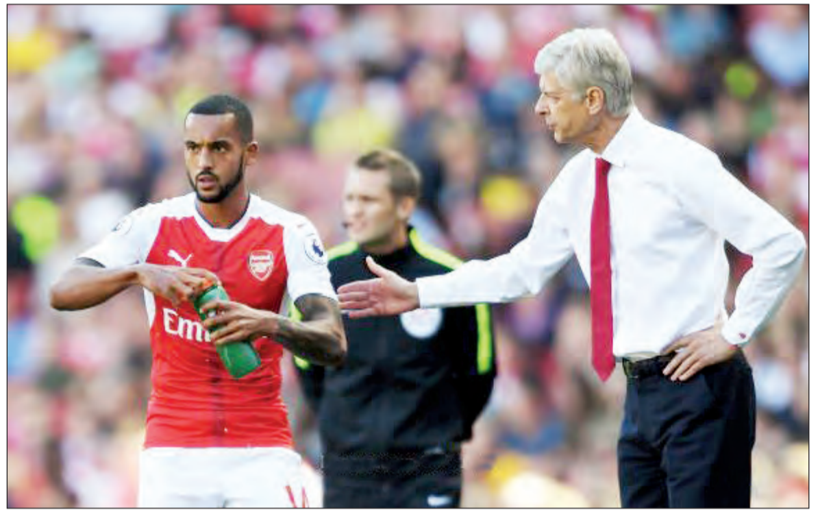
الفرنسي معجب بأداء لاعبه والكوت

المؤتمر الصحافي عقب اللقاء «لا يمكن التشكيك في أداء والكوت». وأضاف «أعتقد أن ما حدث لوكوت أكثر من تغيير، في موقفه هذا الموسم، فهو مستعد للقتال، ويحصل على الدعم دائماً، إنه لاعب مختلف تماماً». وعن آماله مع آرسنال خلال الفترة المقبلة، بعد 20 عاماً من قيادته للفريق،