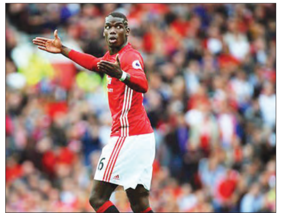
هل انكسرت عقدة الفرنسي؟

يتمنى الفرنسي بول بوغبا، لاعب نادي مان يونايتد الإنجليزي، أن يهدف في رمي بطل الدوري الممتاز ليستر سيتي لا يكون الهدف الأول والأخير له مع فريقه الجديد والذي انتقل إليه هذا الصيف قادماً من يوفنتوس الإيطالي. وقال بوغبا، في تصريحات بعد المباراة نقلتها صحيفة ديلي ستار «أنا سعيد بالنتيجة والهدف الذي سجلته وآمل ألا يكون هدفي هو الأخير لي». وأضاف بوغبا «رؤنا بشكل جيد في المباراة، كنا نعلم أنها ستكون مباراة صعبة أظهرنا أداء جيداً ونريد الحفاظ على ذلك». وختم اللاعب الفرنسي حديثه بقوله «أنا لا أنظر لما تقوله الصحف وساقول شيئاً واحداً فقط، سوف ننتظر حتى النهاية لنرى ما سيحدث».