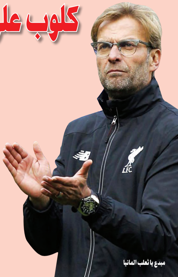
ميدع يا تاعلب المانيا

يرغب نادي بايرن ميونخ الألماني للتعاقد مع يورغن كلوب المدير الفني لفريق ليفربول خلال الفترة المقبلة حيث يعتبر بديلاً مثالياً لكارلو أنشيلوتي المدير الفني الحالي للعلاق الباقاري. وذكرت صحيفة الميرور أن أنشيلوتي ينتهي عقده الحالي في صيف 2019 المقبل، ويتمنى مسؤولو بطل البوندسليغا أن يكون كلوب البديل المثالي. وأكدت الصحيفة الإنجليزية أن كلوب كان قد وقع عقداً مع الريزن لمدة 6 أعوام في وقت سابق من هذا العام. وكان ليفربول يحقق الانتصارات بعد تسجيل ثلاثة أو أربعة أهداف لكنه الآن رفع مستواه وبات يفوز بالخمس تحت قيادة مدربه الألماني. حيث واصل اللبفر إظهار قوته الهجومية وسحق هال سيتي 5-1 وتقدم إلى المركز الثالث في الدوري الإنجليزي الممتاز بفارق خمس نقاط عن مان سيتي المتصدر وصاحب العلامة الكاملة، وهو ما جعل كلوب محط انظار العملاق بايرن كما تؤكد التقارير.