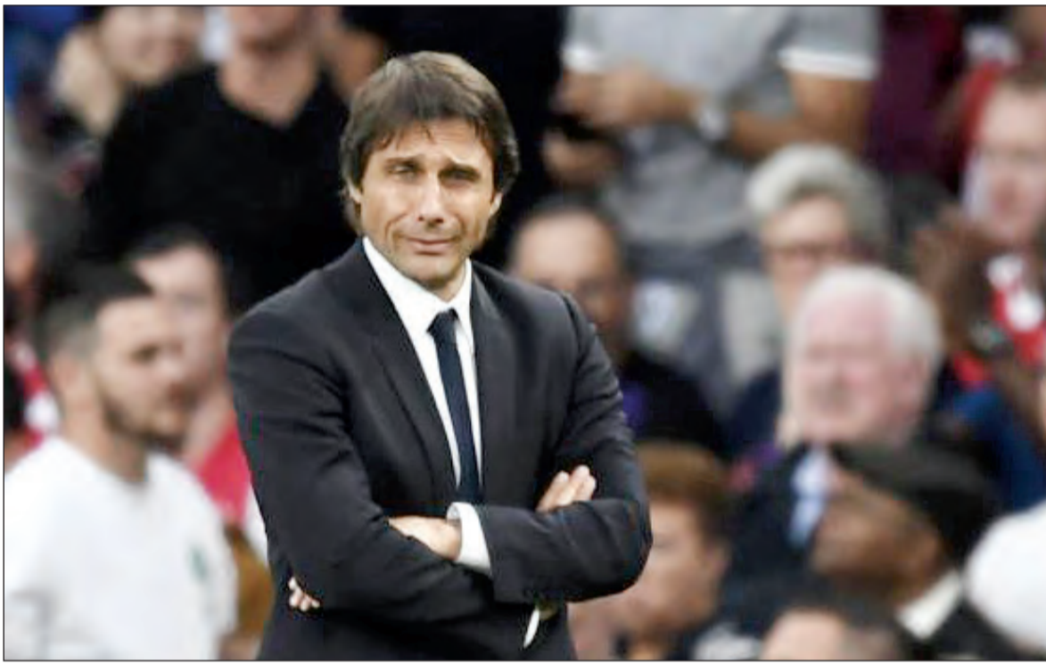
اليطالي حزين على الهزيمة

عظيم على الورق فقط. وتابع: إنها مشكلة الفريق أكبر من الفريديات، حين لا يفعل أي شيء يكون الأمر صعب جداً على اللاعب لكي يلعب جيداً. وعن خطأ غاري كاهيل: «لا أريد الحديث عنه، فالأمر لا يتعلق به وحده، نحن نفوز ونخسر كفريق». وأردف: إذا اعتقد شخص ما أن هذا الفريق قادر على القتال، أعتقد أنه يجب أن تنتظر لكي تثبت الكثير لتعود فريقاً عظيماً على أرض الملعب وليس على الورق فقط. وواصل: «نحن لا نملك التوازن، والآن لحظة فاصلة في كل شيء، فمن غير المعقول أن نتلقى 3 أهداف». وختم بقوله: علينا أن نضع الموسم الماضي في تفكيرنا، لكي لا نكرر الأخطاء نفسها.