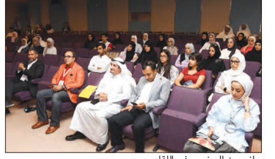
جانبا من الحضور في اللقاء