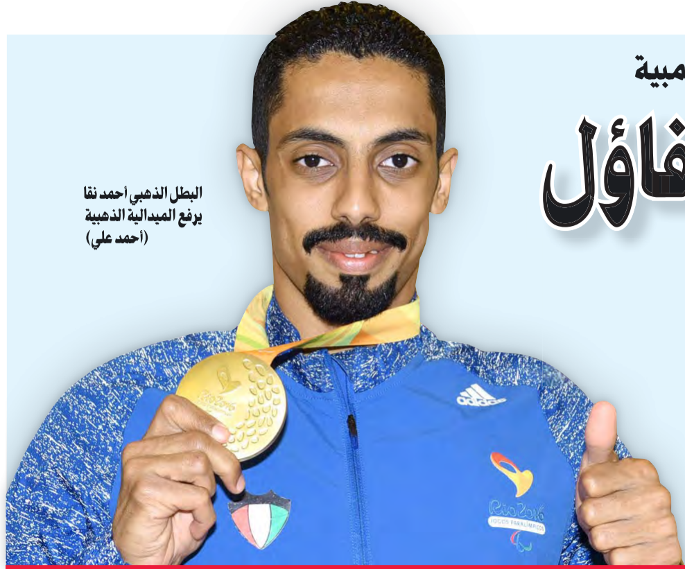
البطل الذهبي أحمد نقا يرفع الميدالية الذهبية (أحمد علي)

بعزيمة صلبة وبجدارة واستحقاق سجل بطلنا الذهبي أحمد نقا المطيري بكل الفخر اسم الكويت في السجل التاريخي بعد أن حقق الميدالية الذهبية في دورة الألعاب البارالمبية لسباق 100 حرة للكراسي المتحركة ويز من قباسي عالمي جديد (16.61 جزءاً من الثانية) والتي أقيمت منافساتها في 7 الشهر الجاري في مدينة ريو دي جانيرو البرازيلية برعاية وحضور الرئيس البرازيلي ميشال تامر. وكعادتها «الانباء» تفاعلت مع الحدث الرياضي التاريخي. حيث استضافت البطل الذهبي نقا الذي سلط الضوء على مشواره قبل التأهل الى دورة الألعاب البارالمبية وبرنامجه الاعدادي وتطلعته الى المشاركة في بطولة العالم في لندن خلال شهر سبتمبر من العام المقبل وأماله في المشاركة في ألعاب طوكيو 2020. فكان هذا الحوار: