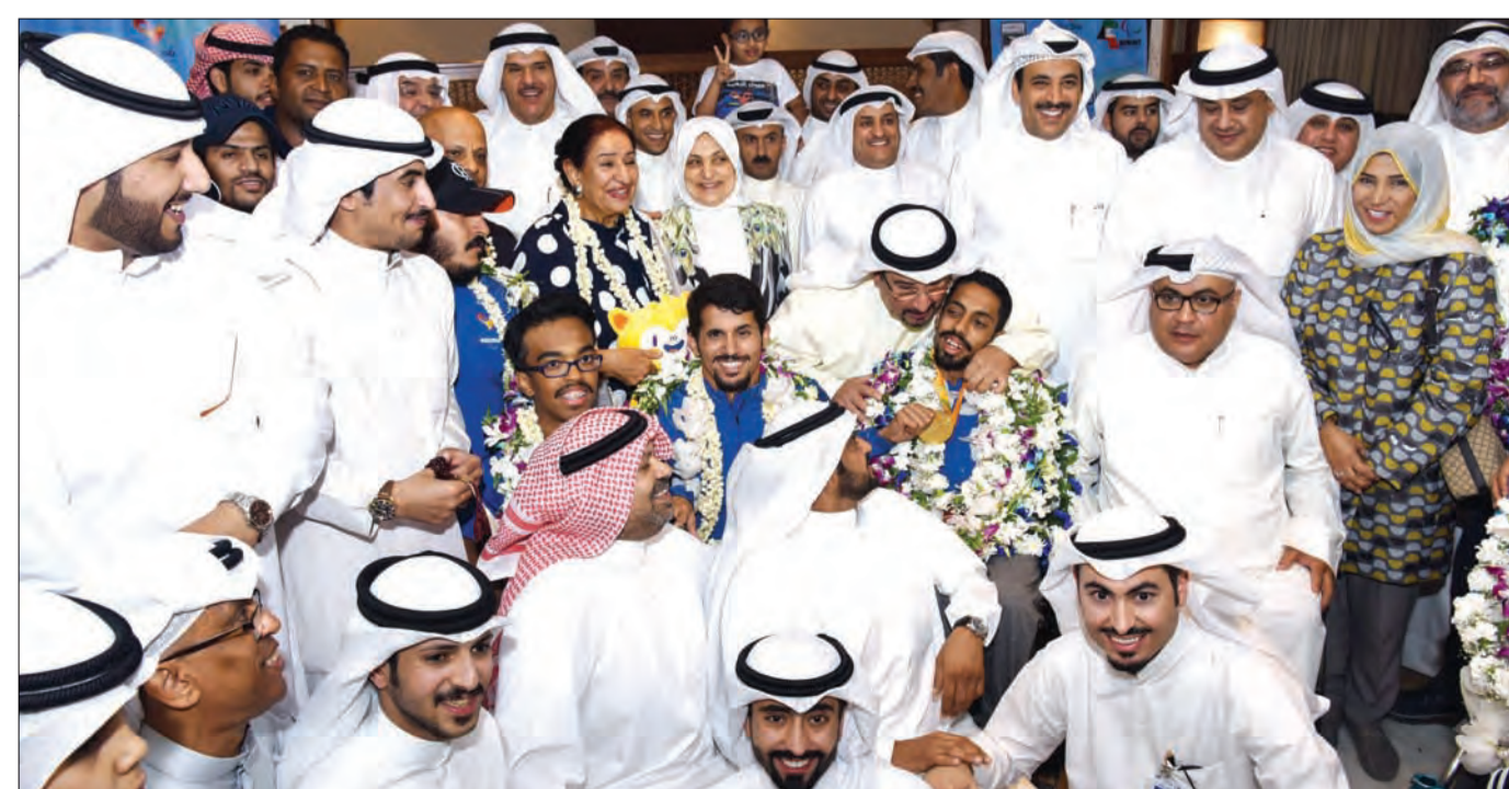
استقبال حافظ لحظة وصوله مطار الكويت