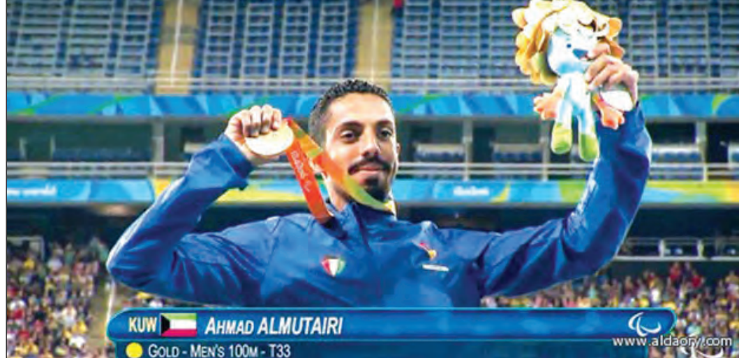
البطل نقا لحظة تتويجه بالميدالية الذهبية