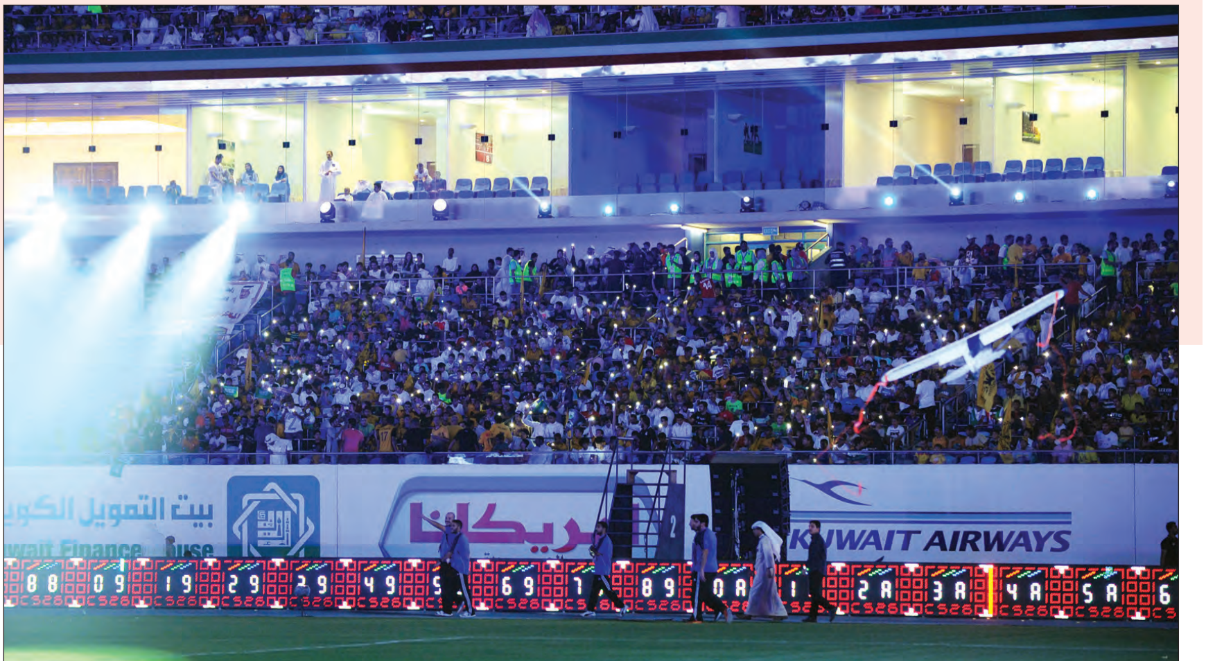
ستاد جابر الدولي يتلأل في مباراة السوبر

على فوز فريقهم ببطولة كأس السوبر وتمنى حظاً أوفر لرئيس واعضاء مجلس ادارة نادي القادسية بعد خسارتهم لقب البطولة في المباراة التي جمعت الفريقين مساء أمس على ستاد جابر الأحمد. وأشاد الحساوي بالدور الكبير الذي لعبته اللجان العاملة المشاركة في تنظيم بطولة كأس السوبر التي عملت واجتهدت وسعت من أجل إنجاح الاحتفالية التي أقيمت على ستاد جابر والتي توافقت عليها الجماهير الرياضية لمؤازرة الفريقين في المباراة التي انتهت لمصلحة الكويت على حساب القادسية بركلات الترجيح. وقال: العمل الذي بذلته اللجان المنظمة كان ملحوظاً، وقد سعينا من أجل رسم البسمة على وجوه الحضور من خلال الاحتفالية التي أقيمت قبل