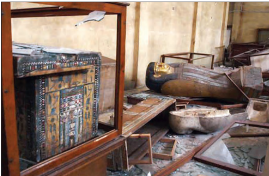
آثار التدمير واضحة على المتحف قبل 3 سنوات

حجرية وخشبية وأوان فخارية. ويضم المتحف الآن بعد إعادة افتتاحه 944 قطعة أثرية منها 441 قطعة من المتحف القديم إضافة إلى 503 قطعة تم إضافتها من مخازن البهنسا والأشموينيين والمنيا بحسب تصريحات وزير الآثار المصري خالد العناني.