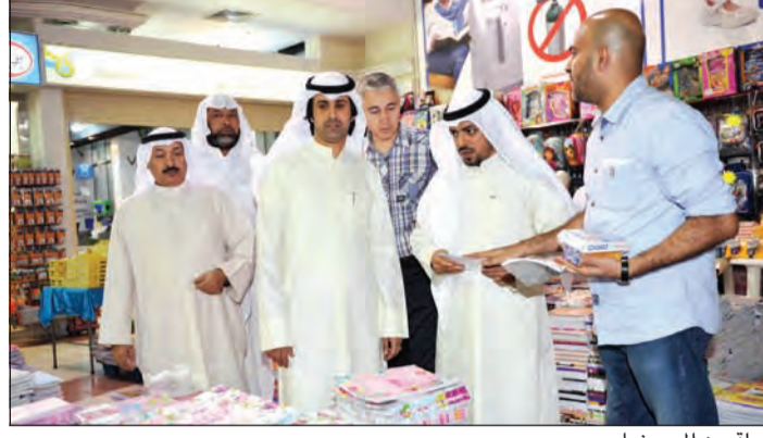
جولة بين العروضات