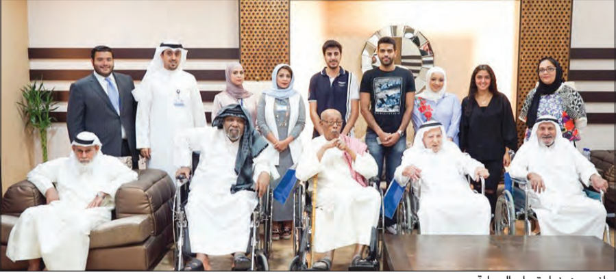
جانب من زيارة دار الرعاية

عن صحتهم وأحوالهم، كما جرى توزيع الهدايا العينية والتذكارية عليهم التي أدخلت البهجة والسرور في قلوبهم. وأشار ناجيا إلى أن «الدولي» حرص على دعم المبادرات الطلابية والمشاركة فيها، ولاسيما الإنسانية منها التي تجسد مبادئ ومفاهيم ديننا الإسلامي الحنيف في صلة الأرحام وإخال البهجة والسرور في النفوس في مختلف المناسبات. واختتم بالتأكيد على التزام البنك بالتواصل مع جميع المؤسسات الاجتماعية والإنسانية في البلاد انطلاقاً من مسؤوليته الاجتماعية الرائدة كمؤسسة مصرفية تعمل وفق أحكام الشريعة الإسلامية وتضع خدمة المجتمع في قائمة أولوياتها.