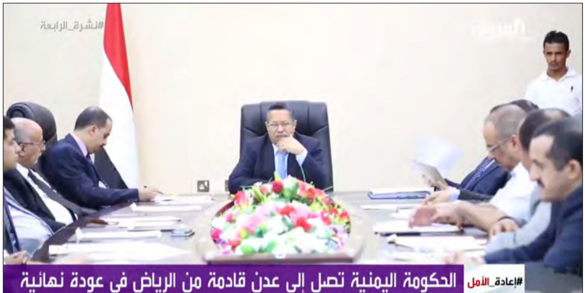
صورة عن تلفزيون «العربية» لاجتماع الحكومة في عدن

إياد احمد ووكلات وصلت حكومة د.أحمد عبيد بن دغر إلى العاصمة المؤقتة عدن في عودة نهائية لمباشرة أعمالها من هناك بناء على توجيهات من الرئيس اليمني عبد ربه منصور هادي.