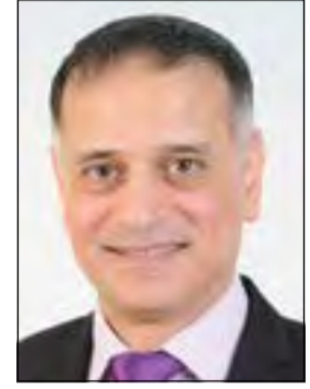
إعداد: د. طارق البكري