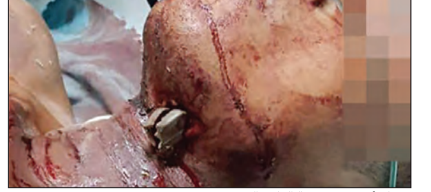
صمام أنبوب في رقبة العامل الهندي