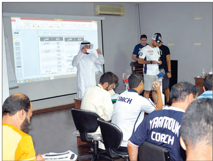
جانب من سحب القرعة