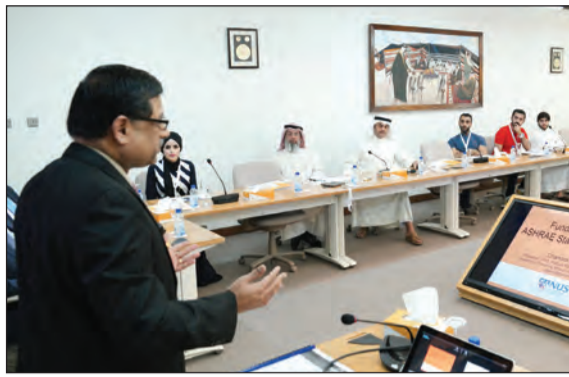
جانب من الملتقى

من أعلى المعدلات في العالم ويبلغ نحو 14,000 كيلواط ساعة/ للفرد سنويا كما أن هناك زيادة مستمرة في الطلب على الكهرباء بمعدلات مرتفعة سنويا ربما تبلغ 7٪ وهذا يتطلب إضافة محطات توليد طاقة كهربائية جديدة باستمرار لرفع طاقة المحطات الحالية التي تبلغ سعتها المركبة نحو 15,000 ميغا واط.