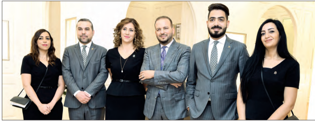
فريق عمل بوشرون

وايت، كما يضم المتجر مجموعة سارايون بوهام التي تحتفي بقصة حب فريدريك بوشرون وزوجته غابريال، بالإضافة إلى باقة مجوهرات الكويت المحدودة والمصممة خصيصاً