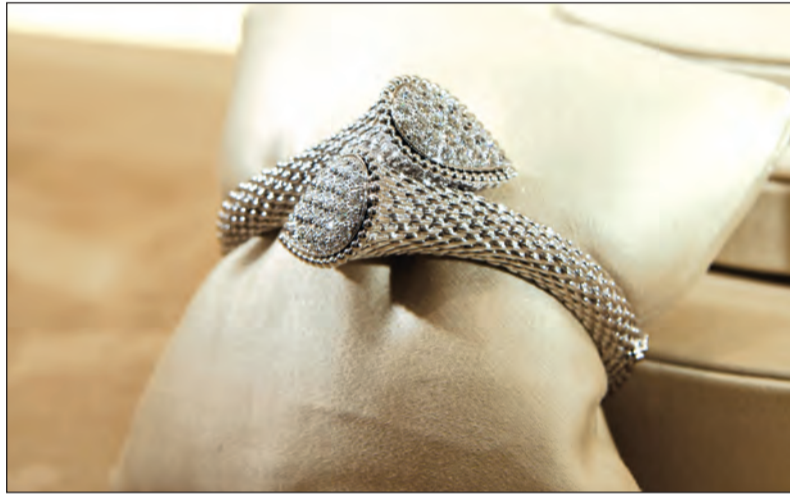
أناقة لا تضامى