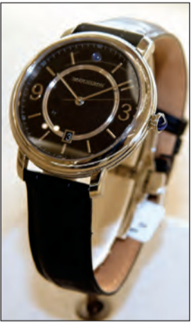
ساعات تجسد التميز الحرفي والعصري

المغطاة بالرخام الأبيض اللون من واجهة متجر الدار التاريخي الذي يقع في 26 ساحة فاندوم الباريسية الشهيرة، والتي اختارها فريدريك بوشرون عام 1893. وهو يمنح زبائنه تجربة