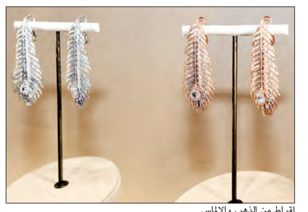
أقراط من الذهب والالاس