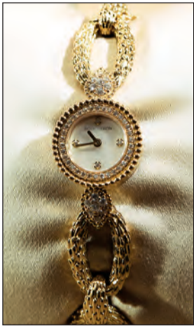
أناقة لا تضامى

وحصريا لعشاق الذوق الراقي في الكويت. كما أن دار بوشرون المشهورة بامتياز كرم ضيافتها على مدى أكثر من 157 عاما ترحب بزبائننا وكانهم أصدقاءؤها. وعبر كل هذه السنوات نسجت معهم أواصر وثيقة من خلال تقديم تصاميم فريدة من نوعها تكون رفيقهم في احتفالاتهم بالمناسبات والحفلات الأكثر أهمية في حياتهم، حيث توفر في إطار التقليد العريق لصناعة المجوهرات الفرنسية الفخمة خدمة الطلبات الخاصة من خلال تجربة استثنائية تطلع الزبون على كل مرحلة من مراحل التصميم وتقدم له قطعاً من النقايس الفريدة والمصممة حصرياً لتكون من ضمن مجموعته ولا يشتركه في جمالها وتميزها أحد على الإطلاق.