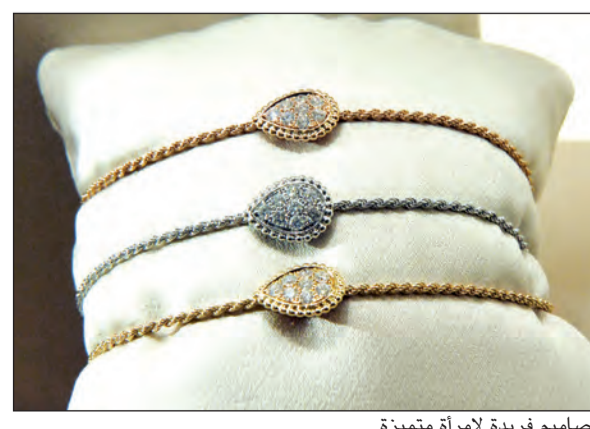
تصاميم فريدة لامرأة متميزة