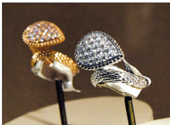
بوشرون تقدم كل جديد