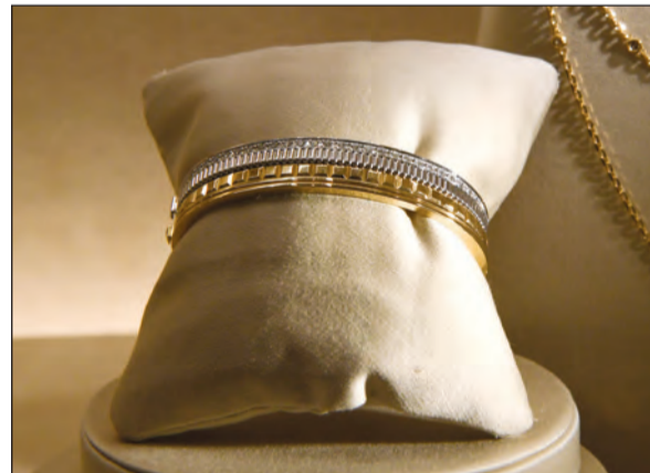
من النقايس الفريدة