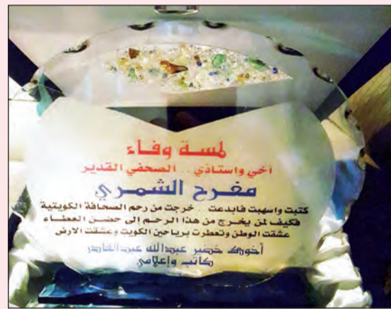
من لمسات الوفاء للراحل مع زملائه في الصحافة