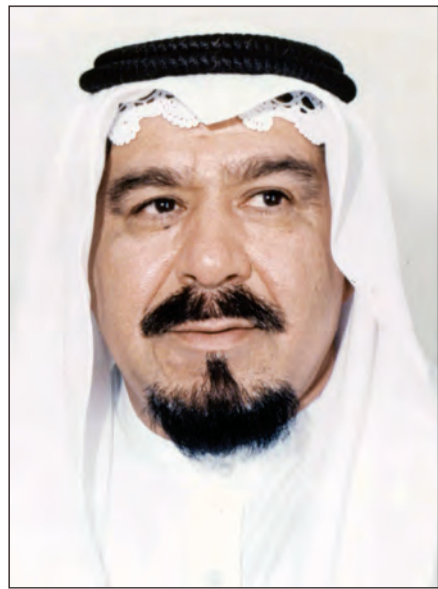
الإعلامي والكاتب الراحل خضير عبدالله عبدالقادر