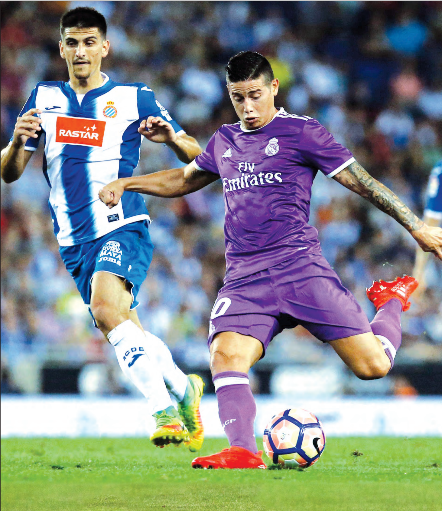
تسديدة خاميس السحرية أهدت الريال الهدف الأول

هذا، وتفتتح المرحلة الخامسة اليوم بقاء يجمع بين ميلان الذي سيحاول استغلال معنوياته العالية عقب فوزه الثمين على مضيفه سميدوربا 1-0 يوم الجمعة الماضي واضعا حدا لخسارتين متتاليتين. ويدرك اللومباردي جيدا ان مهمته لن تكون سهلة امام لاتسيو الذي يتفوق عليه بنقطة واحدة، لكن الروزونيري سيحاول على اعلى ارض والجمهور لكسب النقاط الثلاث ومصالحة جماهيره بعدما سقط امامهم في المرحلة قبل الماضية خلال استضافته اودينيزي 1-0.