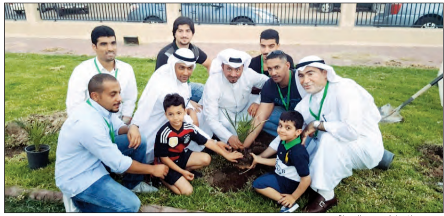
عدد من المشاركين في الحملة