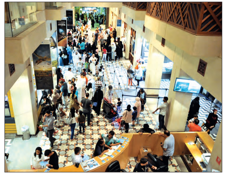
أقبال كبير من المواطنين والمقيمين على زيارة المركز العلمي