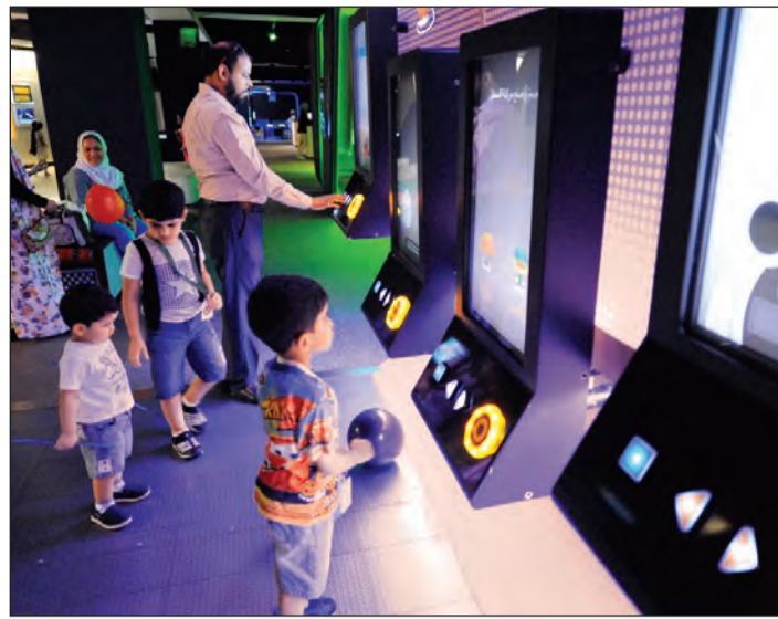
صالة الألعاب المحببة للأطفال