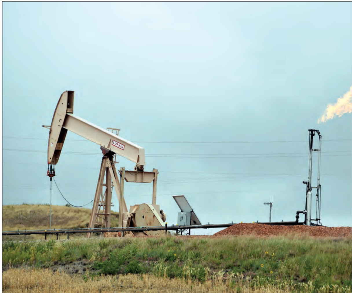
رغم محادثات السعودية وروسيا التي انعكست إيجابا على استقرار الأسعار من المتوقع أن يشهد السوق النفطي تخمة في المعروض حتى نهاية 2017

بمعدل 0,2 مليون برميل يوميا وصولا إلى 56,52 مليون برميل يوميا. وقد كان هذا التعديل في التقدير بناء على التغيير الذي شهده العام 2016 بالاضافة إلى البداية المبكرة لحقل كاشجان في كازخستان والذي يتوقع له أن يصل معدل إنتاجه إلى 37 ألف برميل يوميا في العام القادم. حيث ورد في أحدث التقارير الصادرة ارتفاع الإنتاج بمعدل 23 ألف برميل يوميا في كازخستان، و50 ألف برميل يوميا في النرويج، و40 ألف برميل يوميا في المملكة المتحدة، و30 ألف برميل يوميا في كندا، وزيادة توقعات الإنتاج لكل من الولايات المتحدة الأمريكية، والبرازيل، واليمن، والكويت، وأذربيجان. إلا أن كل تلك الارتفاعات قد قابلها تراجع بمعدل 13 ألف في الإيرادات الصينية، وطبقا لأحدث التوقعات، فإن المعروض في النصف الأول من العام 2017 يتوقع أن يكون أعلى بمعدل 13 ألف برميل يوميا مقارنة بالنصف الثاني من العام 2016، في حين أنه من المتوقع للمعروض في النصف الثاني من العام 2017 أن ترتفع بمعدل 50 ألف برميل يوميا مقارنة بمستويات النصف الأول من العام.