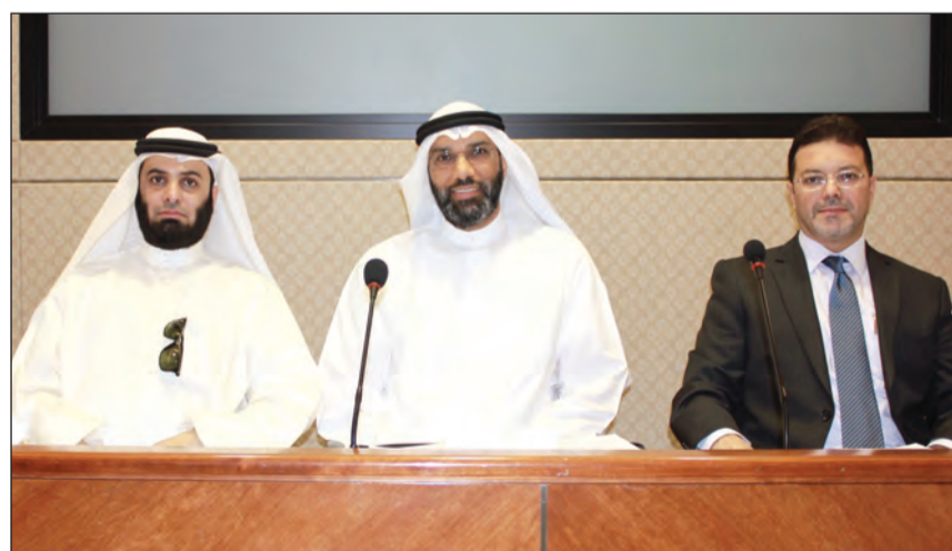
الزميل متوسما الجمعية العمومية

«عمومية» الشركة وافقت على عدم توزيع أرباح «ديمة كابيتال»: استحوذنا على 5 عقارات مدرة للدخل بأميركا