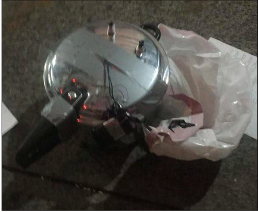
العثور على عبوة أخرى يحتمل أن تكون إثناء طهي على مسافة قريبة من التفجير