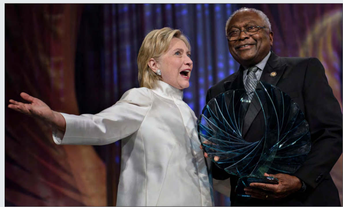
المرشحة الديموقراطية هيلاري كلينتون تتسلم جائزة الريادة خلال مؤتمر «كتلة النواب السود في الكونغرس الأميركي»

المخدرات والمغتصبين. وأوضح امس الاول انه لن يتخلى عن خطه الهجومي حتى لو اغضب ذلك الناخبين من اصول المكسيكيين هم من مهربي لاتينية. وتشكل مسألة الهجرة موضوعا اساسيا لحملة ترامب بعد ان قال في الصيف الماضي ان العديد من المهاجرين المكسيكيين هم من مهربي الالذعة لكلينتون. من بينهم اشخاص قالوا ان اصدقاءهم او اقاربهم قتلوا بابدي مهاجرين لا يحملون وثائق، واصل ترامب انتقاداته الالذعة لكلينتون.