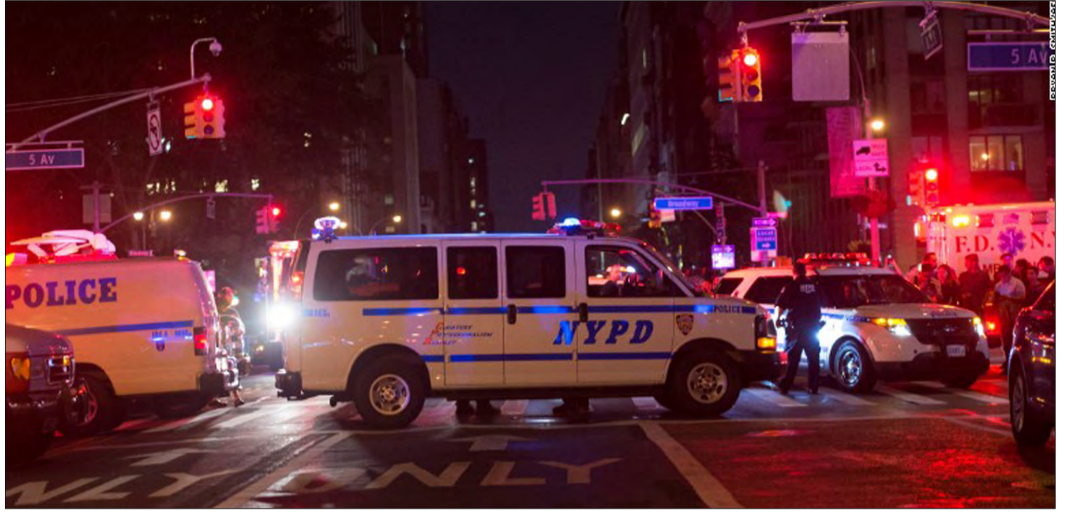
اجراءات أمنية مشددة تحيط بموقع التفجير في حي تشيلسي بمنطقة مانهاتن في نيويورك

في مدينة نيويورك والذي لا يزال سببه قيد التحقيق». وأضاف «سيجرى إبلاغ الرئيس مع توافر معلومات إضافية». وانفجرت عبوة يدوية الصنع في وقت سابق أمس في الأول في حاوية نفايات الانتخابية للاقتراع الرئاسي في الثامن من نوفمبر والتي يتنافس فيها المرشح الجمهوري دونالد ترامب ووزيرة الخارجية السابقة ومرشحة الديموقراطيين هيلاري كلينتون. وسارع ترامب إلى الإعلان من كولورادو سيرتفع ان عبوة انفجرت في نيويورك. «مضيفا علينا ان نبتدي حزما. الكثير من الحزم». الا ان كلينتون علقت بالقول «من الأفضل دائما التريث للحصول على المعلومات قبل الخروج باستنتاجات». وقال العديد من سكان حي تشيلسي لقنوات التلفزيون المحلية أنهم سمعوا نوي انفجار عنيف. وتحطم زجاج العديد من ابواب وواجهات المتاجر التي سارع الكثير منها إلى إغلاق ابوابه. ودوت صفارات عربات الاسعاف والشرطة طوال الليل في الحي الذي حلقت فوقه المروحيات كما طوقت الشرطة المنطقة لكن دون ان تقوم بإجلاء السكان. حسبما افاد مراسل وكالة فرانس برس. وتعتبر نيويورك البالغ عدد سكانها 8,5 ملايين المدينة الاكبر من حيث عدد السكان في الولايات المتحدة. إلى ذلك، تبني تنظيم