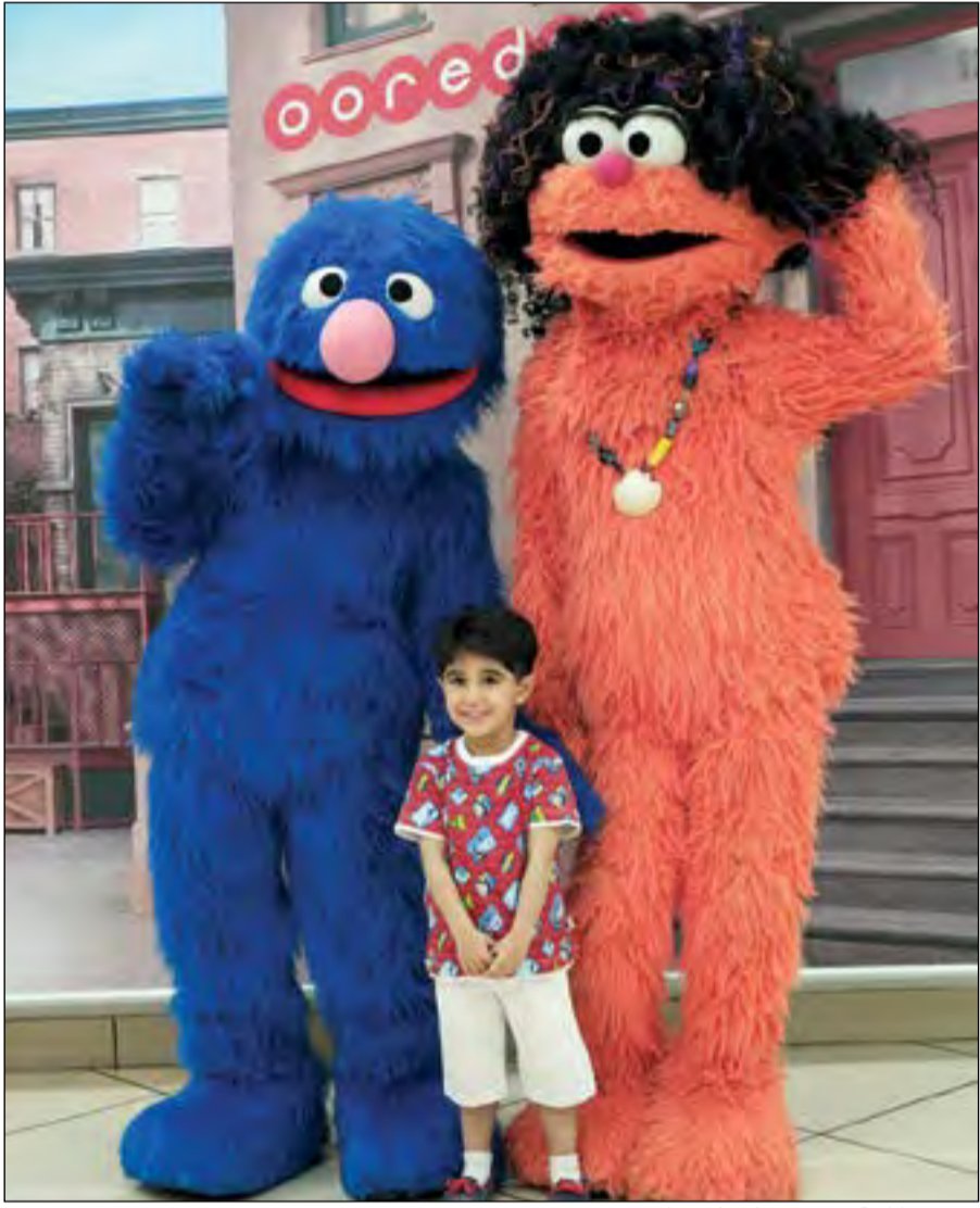
صورة تذكارية مع شخصيات «افتح يا سمسم»

مع الجمعية الكويتية لرعاية الأطفال في المستشفى «KACCH». وتجدر الإشارة إلى أن عدد الحضور طيلة أيام عرض المسرحية فاق الـ 10 آلاف شخص، وذلك على مدى 3 عروض امتدت لمدة 3 أيام ابتداء من ثاني أيام العيد، وتوفرت تذاكر المسرحية في أفرع «Ooredoo» في مجمع الأفتيون ومجمع 360 ومجمع Gate Mall قبل إجازة العيد، كما حصل عملاء الشركة على خصم خاص وذلك على التذاكر الذهبية والبلاتينية.