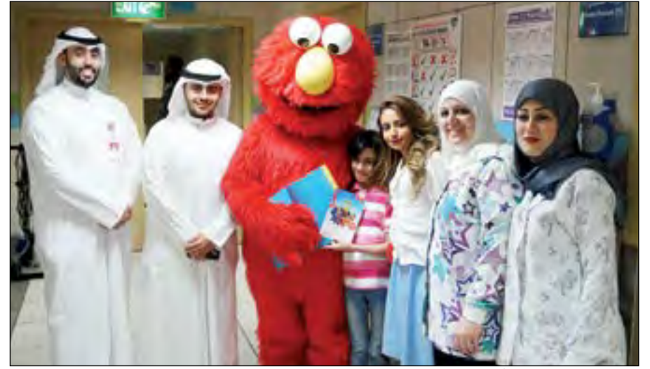
فريق العمل يقوم بزيارة أحد المستشفيات بصحبة شخصيات «افتح يا سمسم»

الحضور فاق الـ 10 آلاف طوال أيام عرض المسرحية