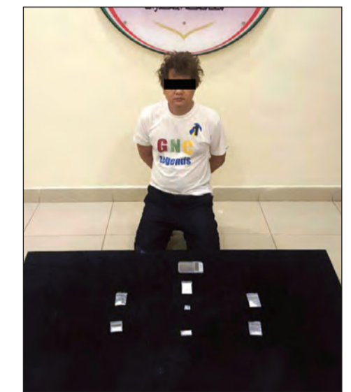
تجار المواد المخدرة وامامهم المضبوطات قبل إحالتهم إلى النيابة العامة