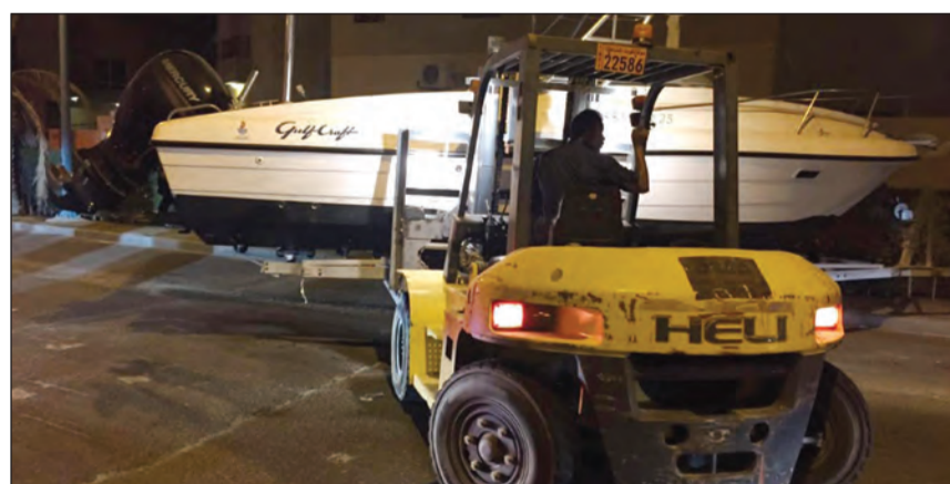
طرايد مهمله رفعت على هامش الحملة الأمنية

الأمر الذي يسبب الإزعاج للعائلات ويعرض حياة الجمع للخطر وكذلك الحفاظ على السلوكيات العامة. وأسفرت الحملة عن ضبط ثلاثه أشخاص مطلوبين للتنفيذ المدني وآخر مطلوب على ذمة قضايا جنائية ومدنية، كما ألقى القبض على مطلوب على ذمة قضايا تغيب وصادر عليه حكم جنائي ومسجل بحقه أمر بالإبعاد عن البلاد، وأسفرت الحملة عن ضبط عدد من الباعة الجائلين ممن لا يحملون تراخيص قانونية بذلك، كما احتجز ثلاثة قوارب ومركبة مطلوبة، كما حررت 380 مخالفة مرورية مباشرة وحجز 4 مركبات مخالفة وتحويل شخصين إلى إدارة الأحداث.