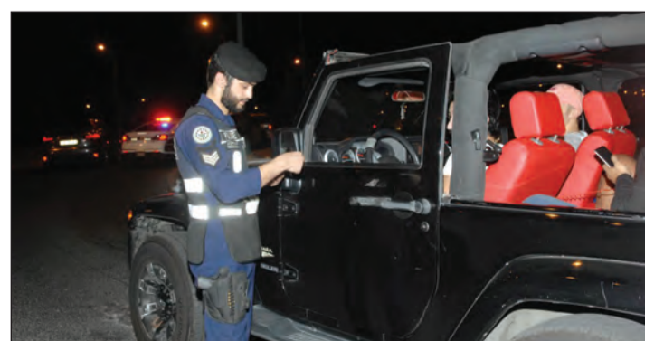
إغلاق الداخل والمخارج لضبط المخالفين والمطلوبين

وأغلقت أجهزة الأمن المشاركة في الحملة محيط المنطقة، في إطار خطة استهدفت التمرکز على مداخلها ومخارجها لمنع المتجاوزين من الهروب ثم