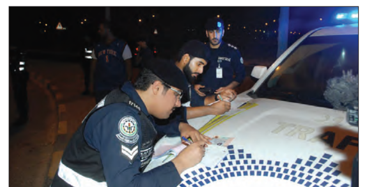
رجال الأمن يحرون مخالفة مرورية