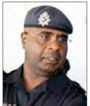
العميد عبدالله سفاح