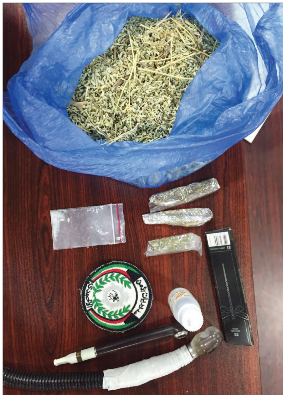
المخدرات المضبوطة مع الوافد المصري