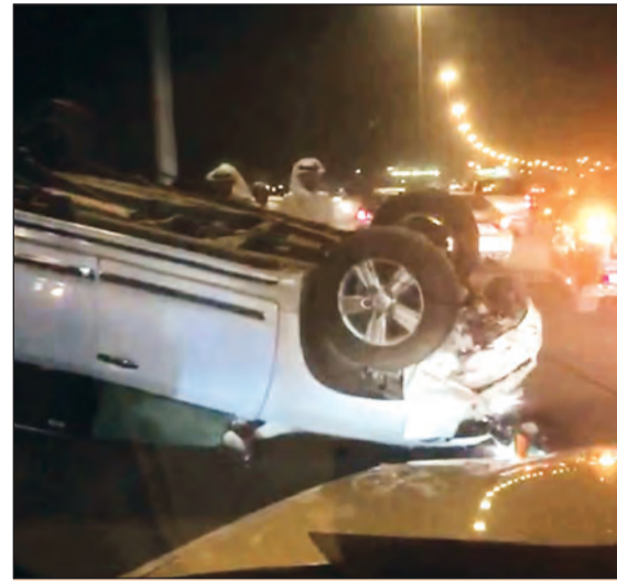
من حادث انقلاب الدائري السادس

التجوال بالمنطقة المبلغ عن خطف الانثى بها دون ان يعثر لها على أثر. وأضاف المصدر انه تم الاتصال عدة مرات على المبلغ ولكنه رفض الرد ثم أغلق الهاتف الذي اتصل منه، وعليه امر محقق المخفر بتسجيل قضية. من جهة أخرى أصيب مواطن بانقلاب مركبة على طريق الدائري السادس مقابل سعد العبدالله.