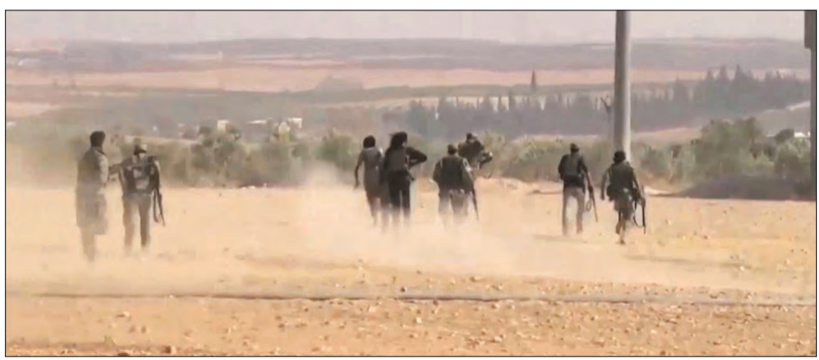
صورة أرشيفية لعدد من مقاتلي الجيش الحر المشاركين في معركة درع الفرات

وكالات: أعلنت المعارضة السورية أمس بدء المرحلة الثالثة من معركة درع الفرات المدعومة من تركيا، بهدف السيطرة على مدينة الباب الخاضعة لسيطرة تنظيم داعش في ريف حلب الشرقي. وبحسب «الجزيرة نت»، فإن المعركة بدأت بقصف وتمهيد مكثف من المدفعية على قريتي بريغيدة وكفرغان الخاضعتين لسيطرة التنظيم في المنطقة.