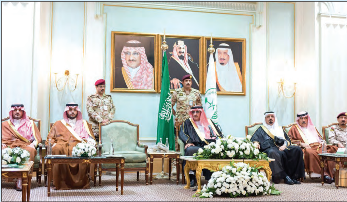
سمو ولي العهد يلتقي مديري وقادة القطاعات العسكرية والأمنية المشاركة في أعمال موسم الحج لهذا العام (واس)

كثيرة والحمد لله علمت بمبدء واحترافية، والحمد لله هذه هي النتائج وهذا شرف لنا جميعا». وحول التناغم في العمل بين الأجهزة المشاركة في حج هذا العام قال: «منذ زمن لم أشاهد تناغما بين الأجهزة كافة مثل ما شاهدته هذا العام، والآن عرفت لنا بما لا يدع مجالا للشك أسس النجاح وهي التناغم بين التنسيق والعمل الجيد لنشعر كلنا كجهاز واحد». وكان اللقاء قد تبئى بتلاوة آيات من القرآن الكريم. ثم ألقى مدير الأمن العام الفريق عثمان بن ناصر المرحج كلمة قال فيها: بفضل الله وتوفيقه تضامرت الجهود وتكاتف همم الرجال في تنفيذ خطط أمن الحج وتوفير أعلى درجات الأمن والحماية لحجاج بيت الله الحرام وفق منظومة متكاملة مشرفة وملحوظة من جميع القوات المشاركة من القطاعات الأمنية والعسكرية وتعاون مشهود من جميع جهات الدولة الحكومية والخدمية الأخرى منذ اللحظات الأولى لاقدم الحجاج للمشاعر المقدسة والجميع يخلصون أعمالهم له سبحانه وتعالى متمثلين لتوجيهات خادم الحرمين الشريفين وسمو ولي عهده الأمين وسمو ولي ولي العهد، وبإشراف ودعم مباشر من سمو ولي العهد، ومتابعة من صاحب السمو الملكي الأمير خالد الفيصل بن عبدالعزيز مستشار خادم الحرمين الشريفين أمير منطقة مكة المكرمة، ومن صاحب السمو الملكي الأمير فيصل بن سلمان بن عبدالعزيز أمير منطقة المدينة المنورة. وأضاف: «اهنئ سموكم الكريم واهنئ نفسي وجميع الزملاء رجال الأمن من كافة القطاعات الأمنية والعسكرية المشاركة في هذه المهمة بنجاح خطط أمن الحج لهذا العام في إنجاز نعتز ونفخر به يضاف إلى سجل الوطن الحافل بالإنجاز والطاء وخدمة ضيوف الرحمن».