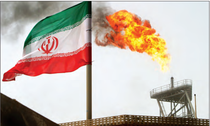
الطلب القوي على الخام الإيراني في آسيا وأوروبا أدى لارتفاع صادراتها النفطية لمستويات عالية