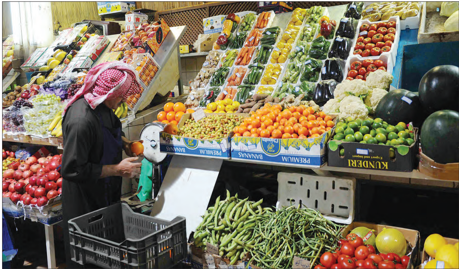
استقرار معدلات التضخم في الكويت خلال شهر يوليو الماضي

قال تقرير صادر عن بيت التمويل الكويتي «بيتك» إن مستوى التضخم الذي يعبر عنه الرقم القياسي العام لأسعار المستهلك وتكاليف المعيشة قد استقر في يوليو الماضي، وذلك وفقا لآخر بيانات صادرة في الكويت، مسجلا مقارنة بالشهر السابق له، 141,6 نقطة ولم يشهد تغيرا وبذلك استقر معدل زيادته حيث بلغت 3,1% خلال شهري يوليو والشهر الذي سبقه، لكنها تاتي أدنى من ارتفاعه السنوي الذي نسبته 3,6% خلال يوليو العام الماضي. وأشار تقرير «بيتك» الى انه وفقا لآخر بيانات صادرة عن وزارة التجارة والصناعة الكويتية نشرت عن شهر مايو العام الحالي، بلغ إجمالي الدعم المنصرف 15,7 مليون دينار في مايو، وقد صرف حوالي 7,5 ملايين دينار في مايو إلى مجموعة المواد الأساسية التوتونية وإلى حليب ومغذيات الأطفال، بينما صرف دعم بما قيمته 8,2 مليون دينار كدعم لمواد البناء الأساسية مثل الإسمنت والطوبوق الجيري والأبيض والحديد.