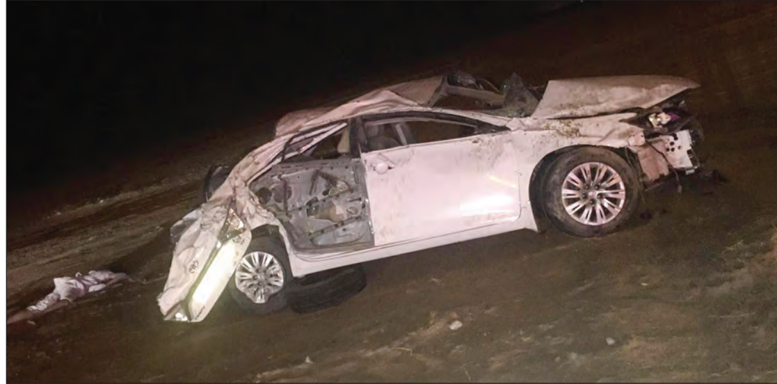
السيارة بعد الحادثة