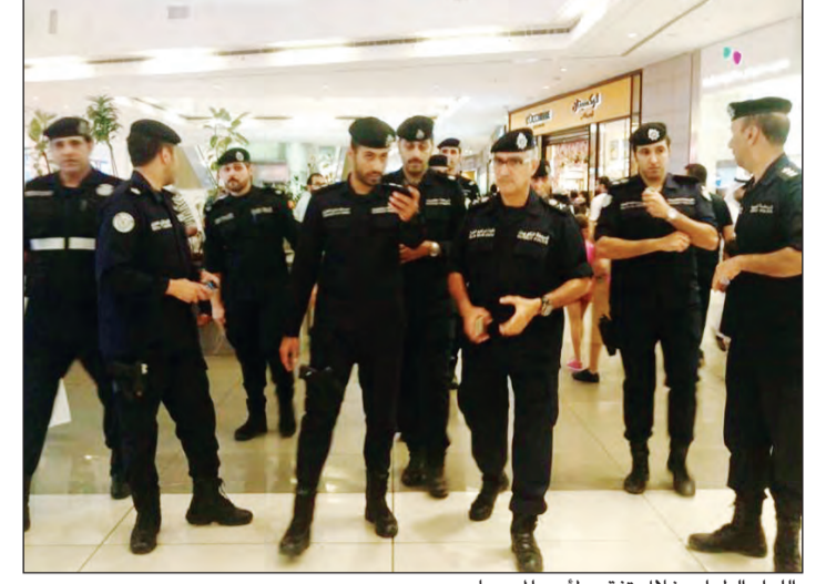
اللواء الطراح خلال تفقده لأحد المجمعات

الدعاس ومحمد الدوسري وناصر العدواني، والمقدم جبيري الجبري. وفي ختام الجولة أكد اللواء الطراح أن الوضع العام خلال الجولة هادئ ومستقر بين مرتادي تلك المجمعات من مختلف فئاتهم، كما أن تعامل رجال الأمن مع الوضع كان على قدر كبير من الحرفية والمهنية.