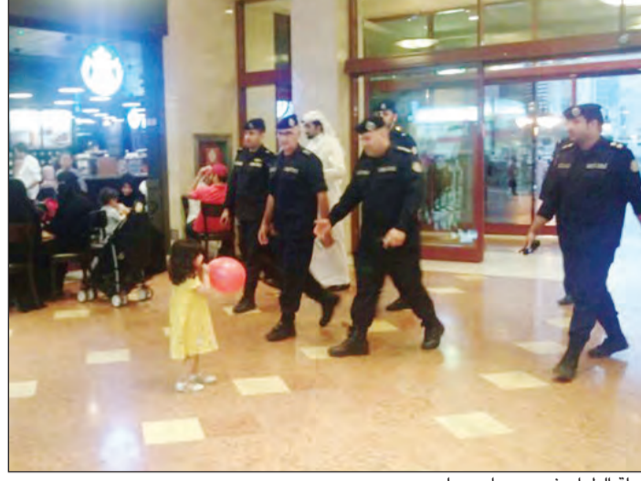
جولة الطراح في مجمعات حولي