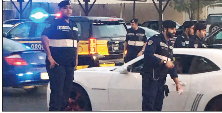
انتشار دوريات النجدة في شوارع العاصمة