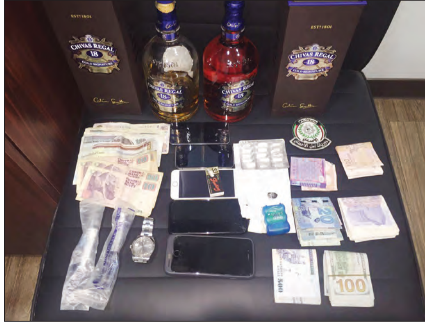
المراد المخدرة التي عثر عليها مع المتهمين