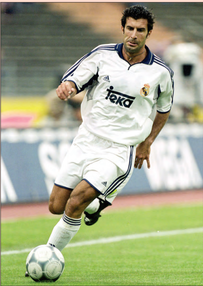
لويس فيغو أسطورة كرة القدم البرتغالية

قال لويس فيغو أسطورة كرة القدم البرتغالية أنه غادر برشلونة لأنه شعر بعدم الاعتراف به وهو ما دفعه للانتقال إلى ريال مدريد، ليتحول من قائد إلى خائن بين جماهير الكامب نو.