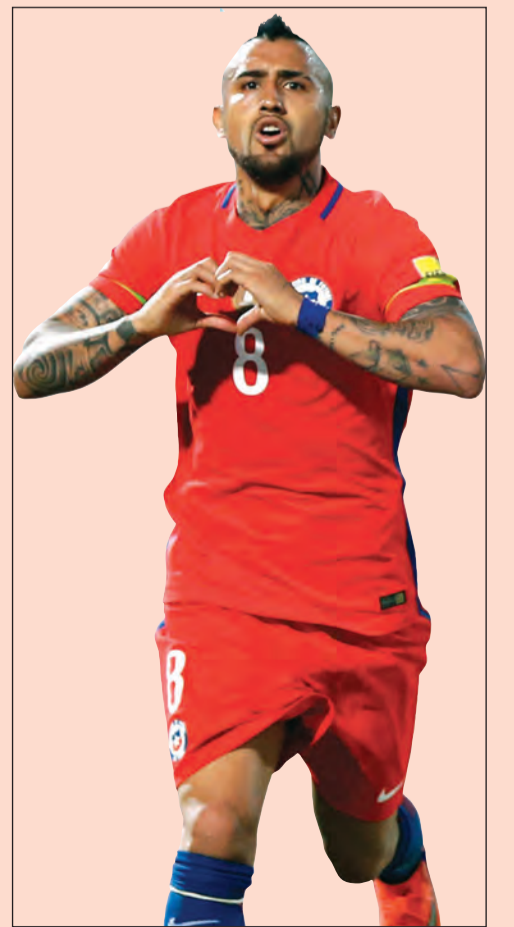
اللاعب الدولي التشيلي أرتورو فيدال

واستطرد نجم وسط ميدان بايرن ميونيخ الألماني، قائلاً: «لماذا علي أن أتساءل؟ هذا الأمر لا ينسى بسبب نتيجة أو نتيجتين سيئتين، من الرائع تذكر هذا الإنجاز عندما لا تسير الأمور على ما يرام لتتذكر أيضاً أننا قادرون على التغلب على أي فريق». ونفى فيدال، أحد أبرز اللاعبين في منتخب تشيلي، أيضاً وجود علاقة متوترة بينه وزميله في المنتخب، المهاجم ألكسيس سانشيز، بسبب التنافس بينهما، وأكد قائلاً: «لا، هذه أمور يتم اختلاقتها، الناس تتخيل أشياء، بالطبع يرغب كلانا في تحقيق الأفضل، ليس فقط في المنتخب، لكن في فريقنا أيضاً ونرغب في رفع اسم تشيلي عالياً في الخارج».