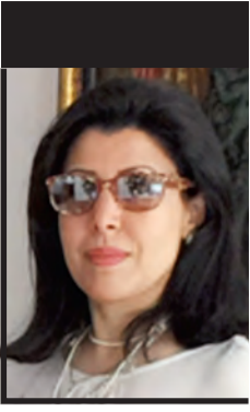
الشيخة حصة الحمود السالم الحمود الصباح