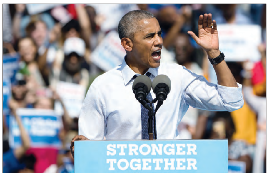
الرئيس الأميركي باراك أوباما ملقيا كلمته في فيلادلفيا ويظهر شعار حملة كلينتون الانتخابية «معا أقوى» (أ.ب)

تكرر مرض هيلاري قد يضع بايدن في المكتب البيضاوي تحقيق في تجاوزات بمؤسسة ترامب وأوباما ينضم لحملة كلينتون «معا أقوى»