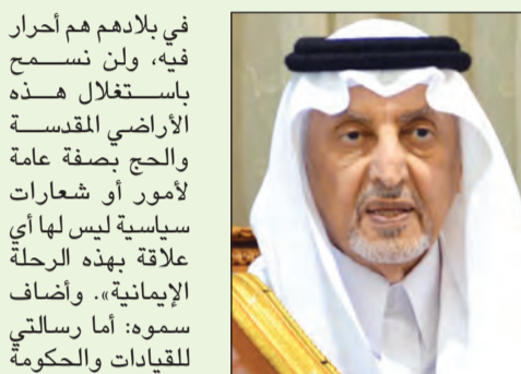
صاحب السمو الملكي الأمير خالد الفيصل

فوج ناصر عبدالله الزاكن عبدالعزیز الفضلي ووكلات