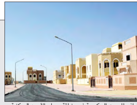
منازل للبيوت الحكومية في منطقة صباح الأحمد السكنية

«الكويتية» تتسلم أولى طائرات «بوينغ» في نوفمبر المقبل 15