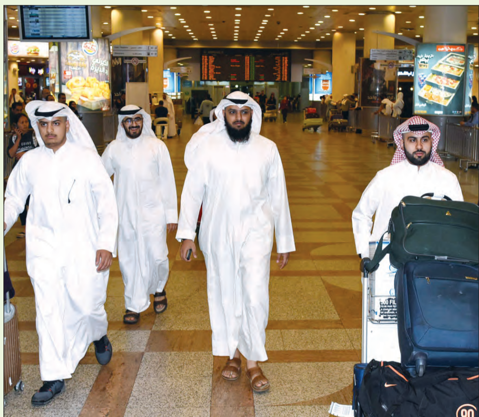
عدد من الحجاج المتعجلين لدى وصولهم إلى مطار الكويت الدولي بعد عصر أمس (أحمد علي)

صاحب السمو هنا خادم الحرمين بالنجاح الكبير لموسم الحج.. وطلّاع حجاجنا العائدين: حج هذا العام «سهلات» أمير مكة لإيران: لسنا لقمة سائغة وسنردع كل معتدٍ