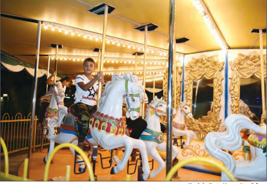
بهجة الصغار هي المعنى الحقيقي للعيد