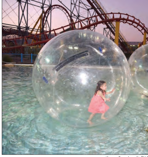
طفلة تلعب في بالون مائي