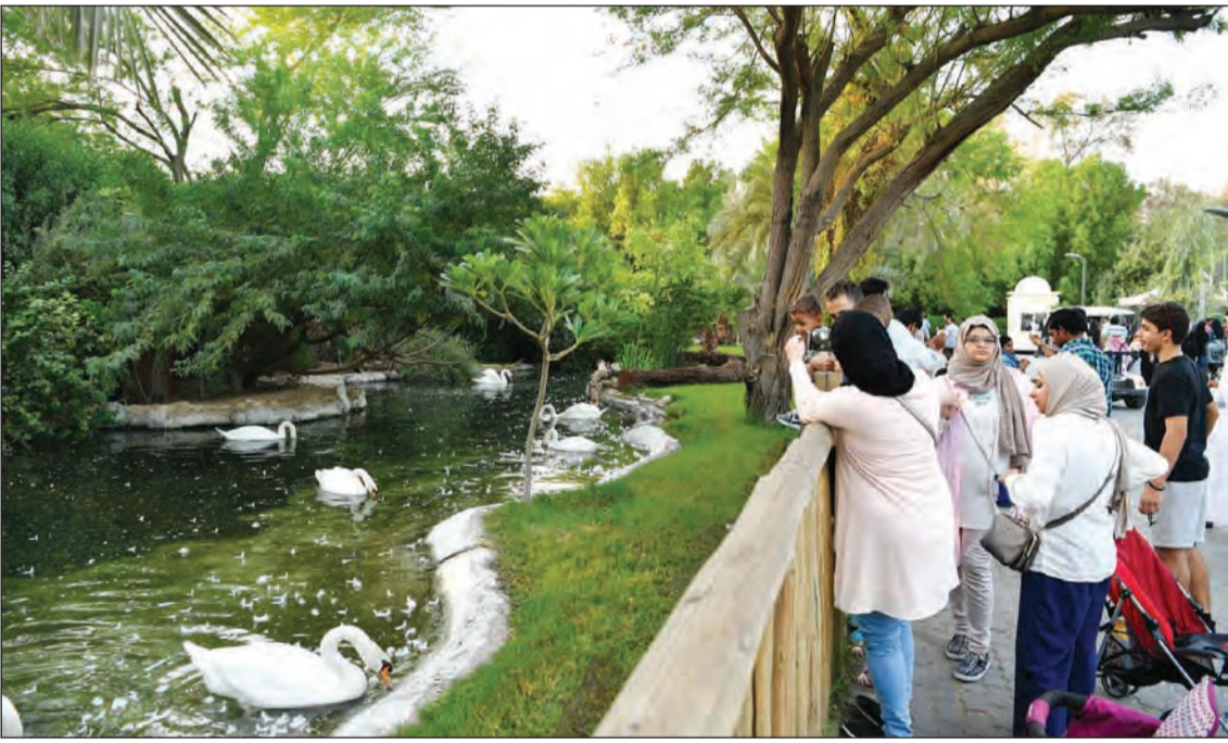
زوار الحديقة يلتقطون الصور للطيور المائية

المرافق العامة أو الإضرار بها. وقد علت فرحة البهجة وجوه جميع الزائرين خاصة الأطفال الذين راخوا يداعبون الحيوانات ويلقون اليها بالأطعمة، فيما جلس الأهالي يتسامرون ويلعبون، معبرين عن سعادتهم البالغة بقضاء أول أيام العيد في هذه الحديقة المتميزة من حيث النظافة والنظام، متمنين ان تظل على هذا النحو طيلة الأيام حيث تعتبر معلما مميذا في الكويت.