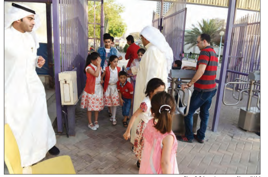
اطفال وملابس جديدة وبداية الرحلة