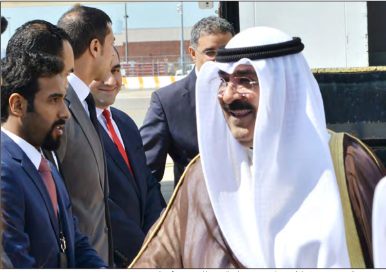
ترحيب بالشيخ مشعل الأحمد لدى وصوله إلى مطار جون أف كندي