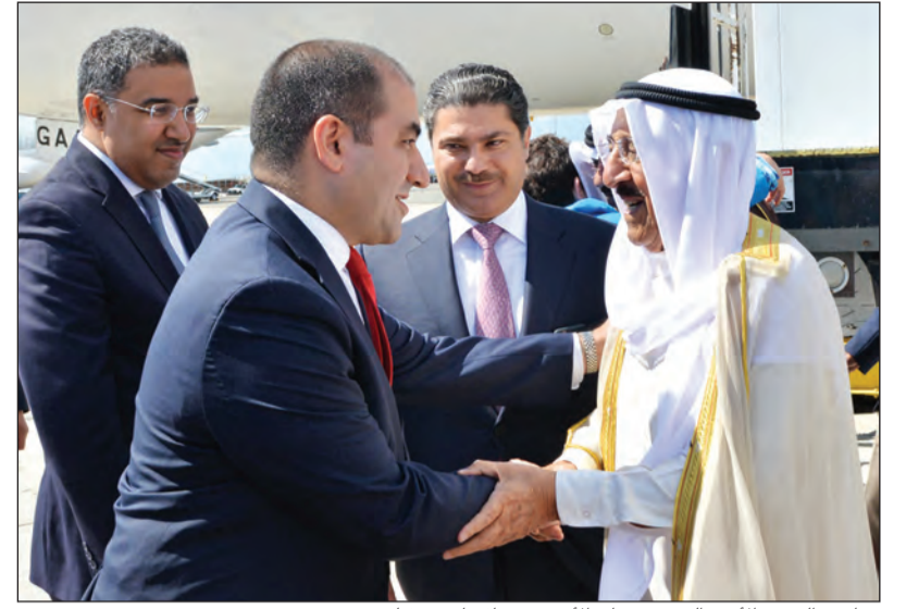
صاحب السمو الأمير الشيخ صباح الأحمد مصافحا مستقبليه