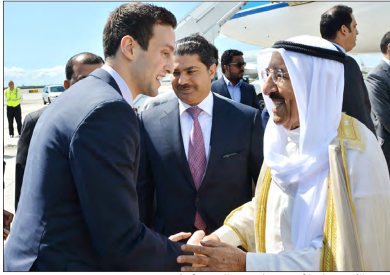
... سمو الأمير مصافحا أحد مستقبليه في مطار جون أف كندي