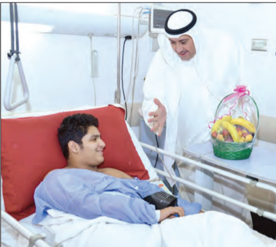
المحمود في حديث باسم مع أحد المرضى ليشد من أزره ويخفف من آلامه