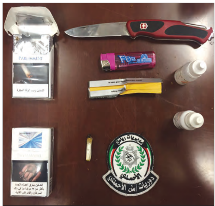
المخدرات وأدوات التعاطي التي ضبطت مع المواطنين

إلى الكيسين عثر بداخلهما على 11 بطل خمر وكيسين بهما مادة عشبية يرجح ان تكون مخدرة «شبو» وتم احالة المضبوطات إلى