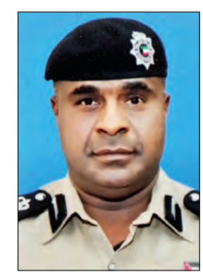
العميد عبدالله سفاح

سفاح تم توقيف وافد مصري تبين أنه من مدين بمبلغ 655 ديناراً ومبلغ آخر قدره 619 ديناراً، كما ضبط بدون مطلوب للسجن 3 اشهر ومواطن مطلوب للسجن لمدة عام ومواطنان عثر بحوزتهما على سيجارة حشيش وكيميكاال إلى جانب تحرير 20 مخالفة مروية. وفي حملة أخرى بمنطقة المنقف تم ضبط مواطن مدين بمبلغ 9125 ديناراً ومواطن آخر مدين بمبلغ 1806 دينارين. كما ضبط رجال أمن العاصمة 3 مدينين أحدهم مطلوب بـ 16 ألف دينار وتم تحويلهم إلى إدارة التنفيذ المدني.