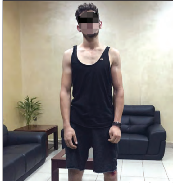
المتهم بعد القبض عليه

يرتدي فانيلة وشورتا أسود قام بسلبه بعد ان انتحل صفة رجال مباحث، وعلى الفور امر مدير عام مديرية امن محافظة الفروانية العميد صالح مطر بنشر دوريات في محيط موقع الجريمة. وخلال قيام رجال الأمن بمهام تمشيط تم خلالها رصد الوافد حيث طلب منه التوقف ولكنه فر على الأقدام لتتم مطاردته حتى سقط أرضا لينتم توقيفه وتبين انه لا يحمل اي إثبات وهو سوري وقال انه الجاني في 12 قضية سلب وسرقة جميعها ارتكبت في محافظة الفروانية.