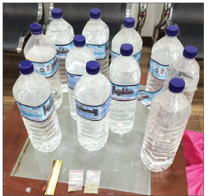
الخمر التي تركها الهارب وتوارى عن الأنظار