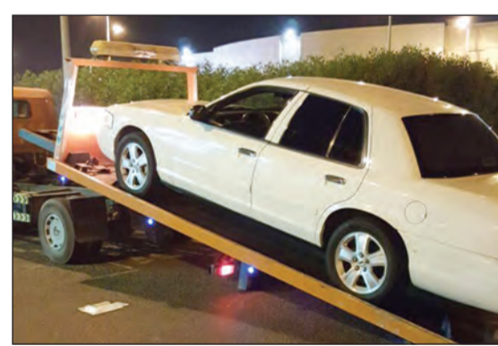
من الحملة المرورية

طوق رجال امن الاحمدي منطقة المهبولة ق3 بحثاً عن مجهول تخلص من مواد مسكرة ومخدرة وهرب إلى جهة غير معلومة، إلا ان جهود رجال الأمن لم تتكفل بضبط الهارب. وكانت احدي دوريات أمن الاحمدي وخلال جولة لها في منطقة المهبولة شاهدت شخصاً بملامح آسيوية يحمل كيسين حيث تم الطلب منه التوقف، وما ان توقفت الدورية إلى جواره حتى انطلق مسرعاً تاركاً الكيسين فما كان من رجال الأمن إلا ان حاولوا اللحاق به، ولكن جهودهم لم تسفر عن ضبط الهارب وبالرجوع