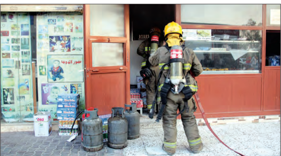
رجال الإطفاء خلال مقاومتهم الحريق