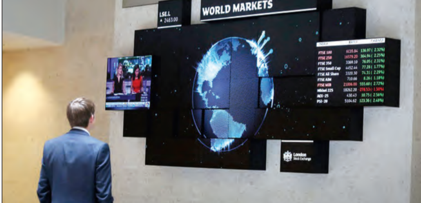
أشهر 3 نحو

لندن - رويترز: سجلت الأسهم الأوروبية أكبر هبوط منذ أواخر يونيو. وتراجع قطاع الموارد الأساسية الذي يتسم بالحساسية تجاه النمو بنسبة 3,5٪ لتتصدر قائمة القطاعات الأسوأ أداءً خلال اليوم في الوقت الذي هبط فيه قطاع البنوك بنسبة 1,9٪. وتصدر سهم إي.أون المدرج في ألمانيا قائمة الخاسرين حيث هوى بنسبة 13٪. وكان مؤشر فايننشال تايمز 100 البريطاني فتح منخفضاً 1,3٪، في حين نزل مؤشر كاك 40 الفرنسي 1,6٪ وداكس الألماني 1,9٪.