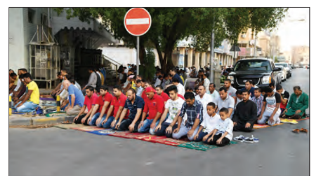
المساجد امتلأت بالمصلين والبعض صلوا على الأرضة