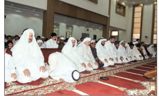
صلاة العيد في أحد المساجد