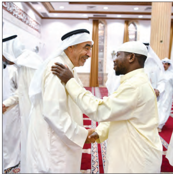
تبادل التهاني بالعيد