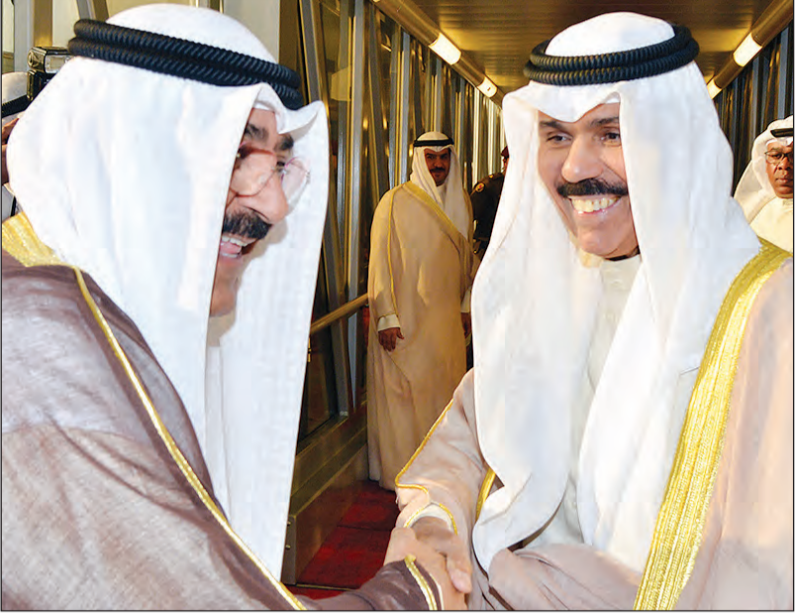
سمو نائب الأمير الشيخ نواف الأحمد وحديث باسم مع الشيخ مشعل الأحمد

تلقى صاحب السمو الأمير الشيخ صباح الأحمد، حفظه الله ورعا، اتصالاً هاتفياً مساء أمس من أخيه صاحب الجلالة الملك حمد بن عيسى بن سلمان آل خليفة ملك مملكة البحرين الشقيقة عبر جلالته خلاله عن خالص تهانيه وأطيب تمنياته بمناسبة حلول عيد الأضحى المبارك، سانالا المولى عز وجل أن يعيد هذه المناسبة السعيدة على سموه والشعب الكويتي بوافر الخير واليمن والبركات وأن يديم على سموه موفور الصحة والعافية. وقد شكر سموه حفظه الله جلالته على هذا المبادرة الكريمة التي تجسد عمق العلاقات بين البلدين الشقيقين مبادلاً سموه التهاني بهذه المناسبة وتمنيا استمرار هذا التواصل الاخوي، مبتهلاً الى الباري تعالى أن ينعم على جلالته بدوام الصحة والعافية وأن يحقق للشعب البحريني الشقيق كل ما يتطلع إليه من رفعة ورقي وازدهار في ظل القيادة الحكيمة لجلالته.