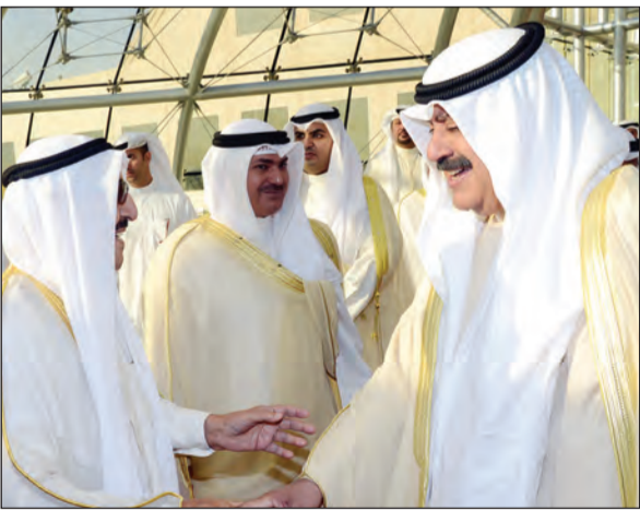
صاحب السمو الأمير الشيخ صباح الأحمد وخالد الجارالله