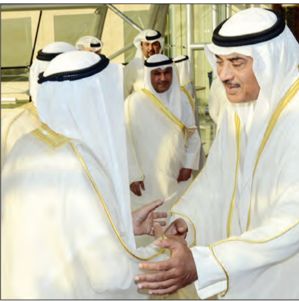
الشيخ صباح الخالد في وداع صاحب السمو قبيل مغادرته إلى الولايات المتحدة

وحفظ الله ورعا، غادر صاحب السمو الأمير الشيخ صباح الأحمد بمبعيته نائب رئيس الحرس الوطني الشيخ مشعل الأحمد والوفد الرسمي المرافق لسموه أرض الوطن صباح أمس الاثنين، متوجهاً إلى مدينة نيويورك بالولايات المتحدة الأميركية الصديقة، وذلك لترؤس وفد الكويت في مؤتمر القمة التي سيعقدها رئيس الولايات المتحدة الأميركية باراك أوباما على هامش الدورة الـ 71 للجمعية العامة لمناقشة أوضاع اللاجئين والنازحين والمهجّرين حول العالم. وكان في وداع سموه على أرض المطار سمو نائب الأمير وولي العهد الشيخ نواف الأحمد وسمو رئيس مجلس الوزراء الشيخ جابر المبارك ورئيس مجلس الأمة بالإنابة مبارك الخرينج والنائب الأول لرئيس مجلس الوزراء محمد الخالد ونائب وزير الخارجية الشيخ صباح الخالد ونائب وزير شؤون الديوان الأميري الشيخ علي الجراح ونائب رئيس مجلس الوزراء ووزير المالية ووزير النفط بالوكالة أنس الصالح وكبار المسؤولين بالدولة. أعاد الله هذه المناسبة على الجميع بالخير واليمن والبركات.