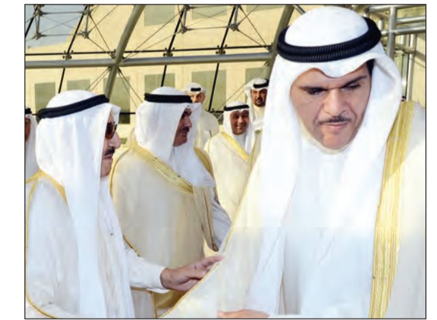
الشيخ سلمان الحمود مودعا صاحب السمو