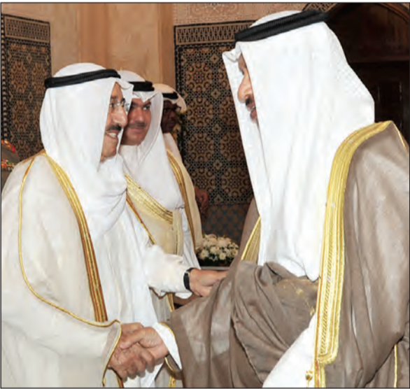
صاحب السمو الأمير يتلقى تهنئة سمو الشيخ جابر المبارك