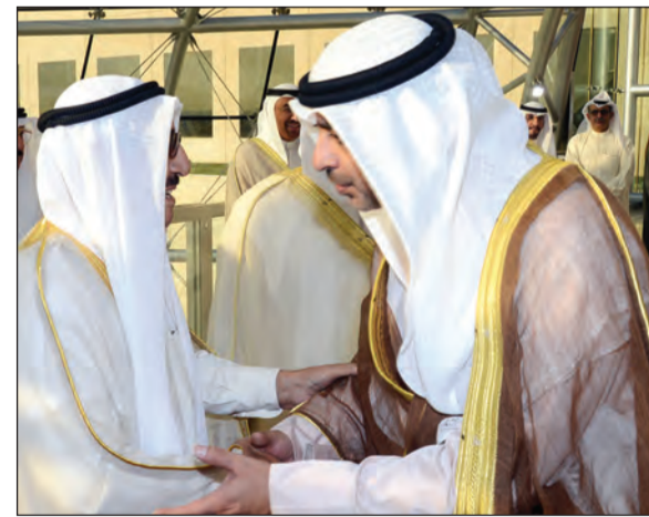
صاحب السمو مصافحا الشيخ محمد العبدالله