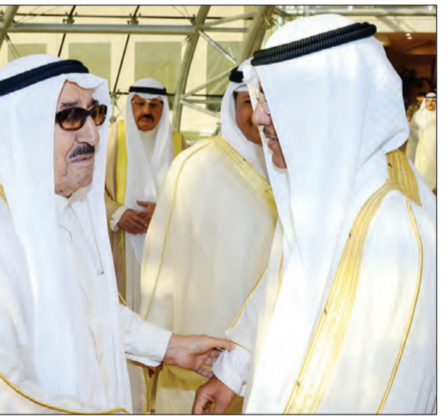
صاحب السمو الأمير الشيخ صباح الأحمد ومبارك الخرينج

وحفظ الله ورعا، غادر صاحب السمو الأمير الشيخ صباح الأحمد بمبعيته نائب رئيس الحرس الوطني الشيخ مشعل الأحمد والوفد الرسمي المرافق لسموه أرض الوطن صباح أمس الاثنين، متوجهاً إلى مدينة نيويورك بالولايات المتحدة الأميركية الصديقة، وذلك لترؤس وفد الكويت في مؤتمر القمة التي سيعقدها رئيس الولايات المتحدة الأميركية باراك أوباما على هامش الدورة الـ 71 للجمعية العامة لمناقشة أوضاع اللاجئين والنازحين والمهجّرين حول العالم. وكان في وداع سموه على أرض المطار سمو نائب الأمير وولي العهد الشيخ نواف الأحمد وسمو رئيس مجلس الوزراء الشيخ جابر المبارك ورئيس مجلس الأمة بالإنابة مبارك الخرينج والنائب الأول لرئيس مجلس الوزراء محمد الخالد ونائب وزير الخارجية الشيخ صباح الخالد ونائب وزير شؤون الديوان الأميري الشيخ علي الجراح ونائب رئيس مجلس الوزراء ووزير المالية ووزير النفط بالوكالة أنس الصالح وكبار المسؤولين بالدولة. أعاد الله هذه المناسبة على الجميع بالخير واليمن والبركات.