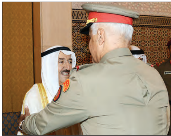
الفريق محمد الخضرمهنا صاحب السمو الأمير الشيخ صباح الأحمد