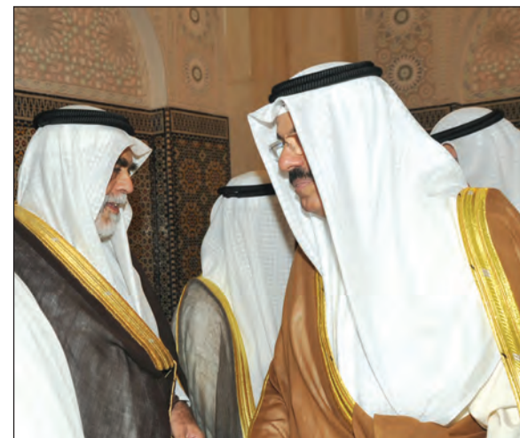
الشيخ أحمد النواف مهنا الشيخ أحمد الخالد