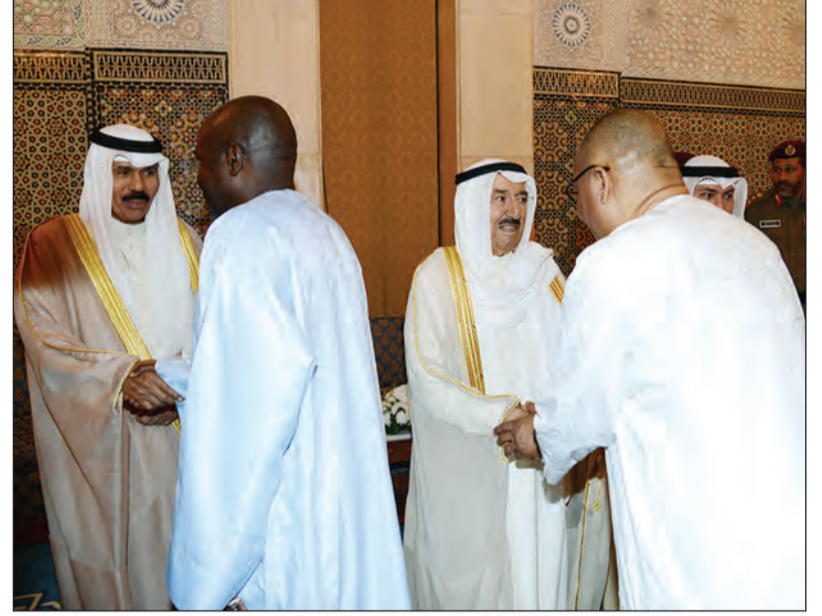
صاحب السمو الأمير الشيخ صباح الأحمد وسمو نائب الأمير الشيخ نواف الأحمد يتلقيان التهاني