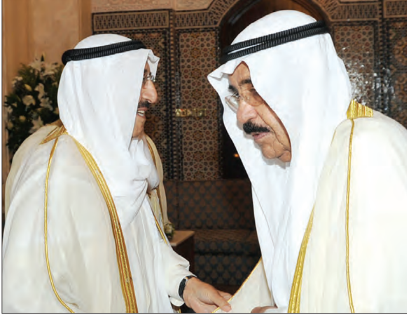
صاحب السمو الأمير الشيخ صباح الأحمد يتبادل التهاني مع الشيخ فيصل السعود