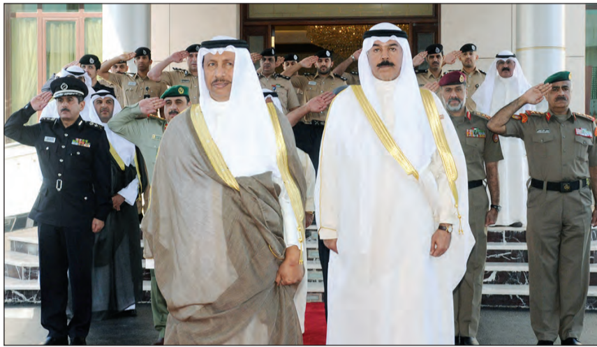
سمو الشيخ جابر المبارك والشيخ محمد الخالد وكبار القادة العسكريين خلال النشيد الوطني في بداية اللقاء بديوانية وزارة الداخلية

والشرطة والحرس والإطفاء الدور الأهم في الوقوف بحزم أمام هذه المحاولات، وأشد أسموه بالضربات الاستباقية التي وجهتها وزارة الداخلية للبحر والمخدرات، مؤكداً أن «البلاد ودول الخليج أصبحت مستهدفة من تجار هذه السموم في محاولة للنيل من أبنائنا وشبابنا وعلينا العمل بكل قوة لمحاربة هذه الآفة والقضاء عليها». ودعا سموه إلى بذل المزيد من الجهد والعطاء لدرء خطر هذه المخاطر الثلاثة ووضع أمن الكويت وسلامة أهلها والمقيمين على أرضها نصب أعينكم. من جهته، أكد نائب رئيس مجلس الوزراء