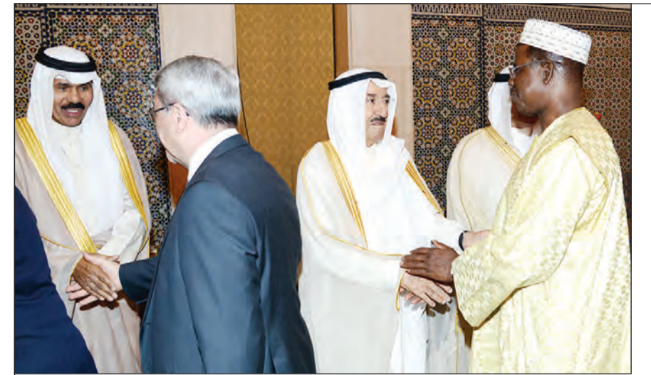
صاحب السمو الأمير الشيخ صباح الأحمد وسمو نائب الأمير الشيخ نواف الأحمد يتلقيان التهاني بعيد الأضحى

حذر سمو رئيس مجلس الوزراء الشيخ جابر المبارك من 3 مخاطر تهدد البلاد وتتطلب الجهد والحزم لمواجهتها وهي: محاولات المساس بالوحدة الوطنية، وظاهراً للإرهاب والمخدرات. وأكد المبارك، في لقاء مع كبار القيادات في الجيش والشرطة والحرس الوطني والإطفاء والمتقاعدين بالمؤسسة الأمنية، أن الحكومة تدعم وتساند المؤسسة الأمنية بكل قوة وأن الجيش والحرس الوطني والإطفاء ركائز لدعم أمن الوطن، لافتاً إلى أن جاهزيتهم لم تات من فراغ وإنما من جهد وعمل دؤوب والكل يشهد لالاء المتتمين لرجال الأمن. وأوضح سمو رئيس الوزراء أن دور المواطن في المنظومة الأمنية دور محوري وأساسي لا يمكن الاستغناء عنه فلا بد من التفاعل بينهما، مشدداً على ضرورة التمسك