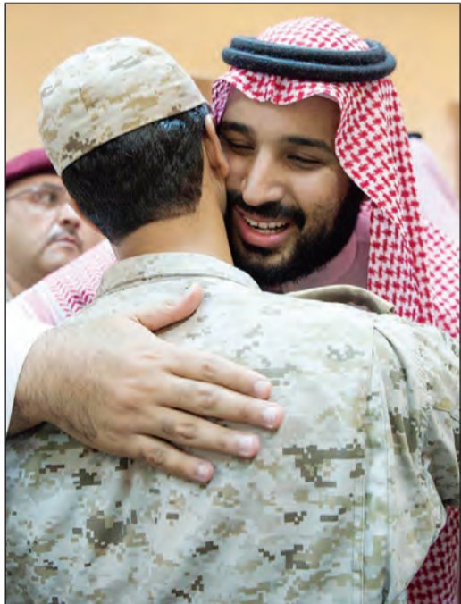
صاحب السمو الملكي الأمير محمد بن سلمان خلال جولته في «الحد الجنوبي»

عواصم - وكالات: أدى صاحب السمو الملكي الأمير محمد بن سلمان بن عبدالعزيز ولي ولي العهد النائب الثاني لرئيس مجلس الوزراء وزير الدفاع السعودي صلاة عيد الأضحى المبارك مع منتسبي القوات المسلحة وقوات تحالف دعم الشرعية في اليمن المرابطة عند الحد الجنوبي بمنطقة جيزان، وعقب الصلاة تبادل ولي العهد وضباط وأفراد من القوات المسلحة وقوات التحالف التهاني بحلول عيد الأضحى المبارك، وتبادل الأمير محمد بن سلمان المحادثة مع ضابط كويتي أثناء زيارته للمرابطين الكويتيين بالحد الجنوبي وقال له «حنا وياكم سوا واللي يجيكم يجينا».