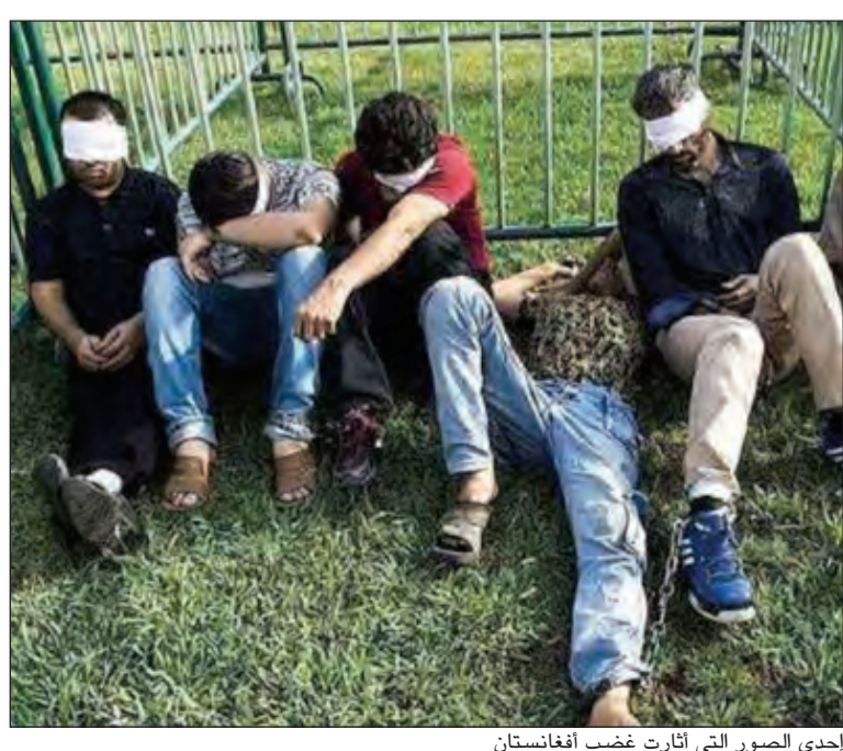
إحدى الصور التي أثار غضب أفغانستان

الحدث.نت: احتجت الحكومة الأفغانية بشدة على سوء المعاملة التي تلقاها عدد من لاجئي بلادها في مدينة شيراز الإيرانية، ووصفت وضع اللاجئين الأفغان في الأقفاس بحجة الدخول غير الشرعي، بالعمل اللاإنساني وإهانة للإنسانية، بحسب تعبير متحدث وزارة الهجرة الأفغانية. وكانت الشرطة في شيراز جنوب إيران قد وضعت عددا من اللاجئين الأفغان في الأقفاس كالحبوانات، ضمن معرض لـ «مضبوطات مخافر المدينة»، الأمر الذي أثار غضب رواد مواقع التواصل الاجتماعي الأفغان، الذين وصفوا هذا التصرف بالإنساني والعنصري. وندد أحمد مياخيل، المتحدث باسم وزارة الهجرة الأفغانية، في حديث لراديو «فرده» الأميركي الناطق بالفارسية، بسوء المعاملة الذي يتكرر بين الحين والآخر بطرق مهينة ضد اللاجئين الأفغان في إيران، ووصفه بالعمل اللاإنساني وإهانة للكرامة الإنسانية. التي أثارها الحادثة في مدينة شيراز، معترفة بوضع الأفغان وراء السياج رغم أنها حاولت تبرير ذلك بالعمل الروتيني، وأنه لم يقصد منه إهانة الأفغان. وناقض بيان السفارة الإيرانية في كابول ما صرح به الشرطة الإيرانية في شيراز حول أسباب اعتقال اللاجئين الأفغان ووضعهم في الأقفاس بالطريقة المهينة، كما تبين الصور المنشورة على مواقع التواصل الاجتماعي، ففي حين تقول الشرطة إنه تم اعتقال هؤلاء الأفغان بتهمة السرقة وتوزيع المخدرات، قالت السفارة الإيرانية في كابول إن الاعتقال كان بسبب الدخول والإقامة غير الشرعية في البلاد.