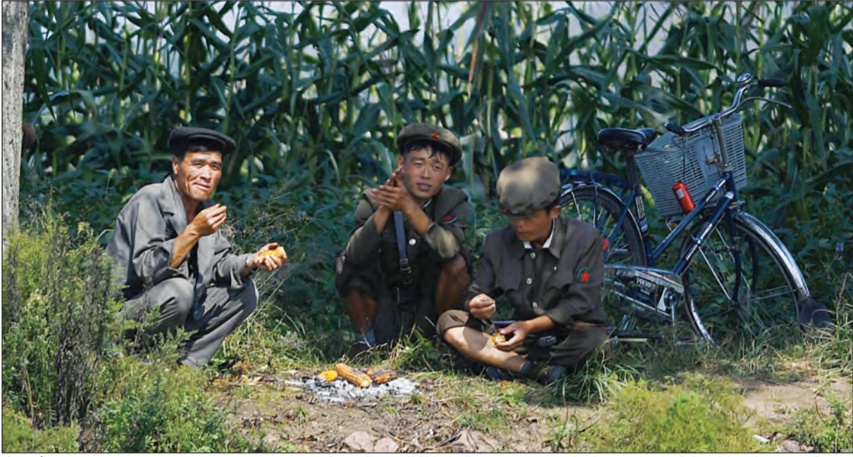
مجموعة من جنود كوريا الشمالية خلال الاسترخاء على جزيرة في نهر يالو المقابلة للحدود الصينية

وأضاف المسؤول «إن القوات المسلحة في البلدين عززت قدراتها لتدمير المنشآت العسكرية الأساسية في كوريا الشمالية في حالات الطوارئ بعد إجرائها التجربة النووية الخامسة التي جعلت من التهديدات كوريا الشمالية النووية واقعا»، حسب يونهايب. إلى ذلك، قالت كوريا الشمالية إن من أسعاف فرض المزيد من العقوبات على بيونغيانغ في أعقاب تجربتها النووية الخامسة «مخيرة للضحك» وتعهدهت بمواصلة تعزيز قدراتها النووية. والتقى مبعوث أميركي خاص مع مسؤولين يابانيين أمس وقال في وقت لاحق إن الولايات المتحدة قد تفرض عقوبات أحادية الجانب على كوريا الشمالية مكررا بذلك تعليقات الرئيس الأميركي باراك أوباما الجمعة الماضية في أعقاب الاختبار.