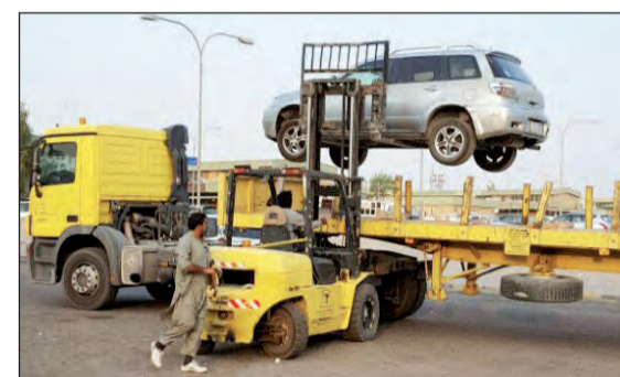
رفع إحدى السيارات

داخل المسلخ بحيث لا تعيق حركة سير المضحين، متمنا جهود الجمعيات التعاونية في المحافظة، حيث سيتم تخصيص أماكن خاصة لكل منطقة في المحافظة. وناشد العرادي الجمهور التعاون مع موظفي البلدية ورجال الأمن بالالتزام بالأماكن المخصصة لهم خلال عملية الذبح، وذلك حفاظا على سلامتهم وتحاشيا للأزدحام الذي يشهده المسلخ خلال أيام العيد. وأشار إلى أن فرع البلدية وبنين ان دور إدارة السلامة بخص بوزارة التعدادات على أسلاك الدولة، وبالأخص التعدادات التي ورد بشأنها شكاوى ومنها إغلاق الممرات وإشغال الطريق إلى جانب