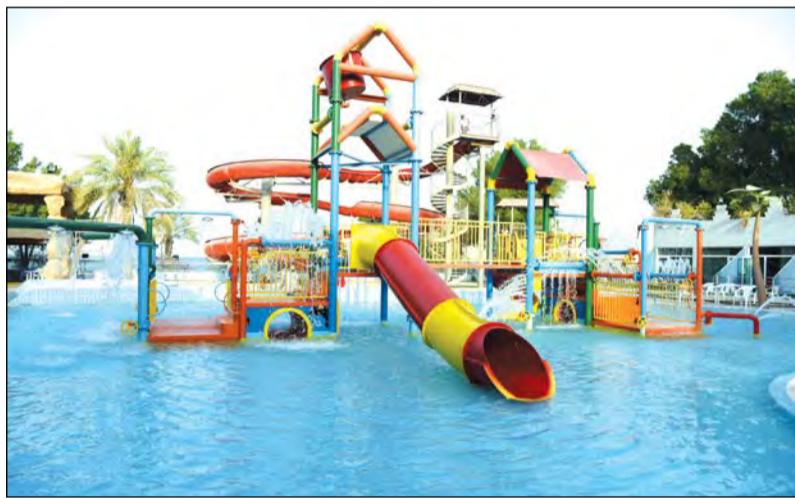
العاب مائية للصغار والكبار