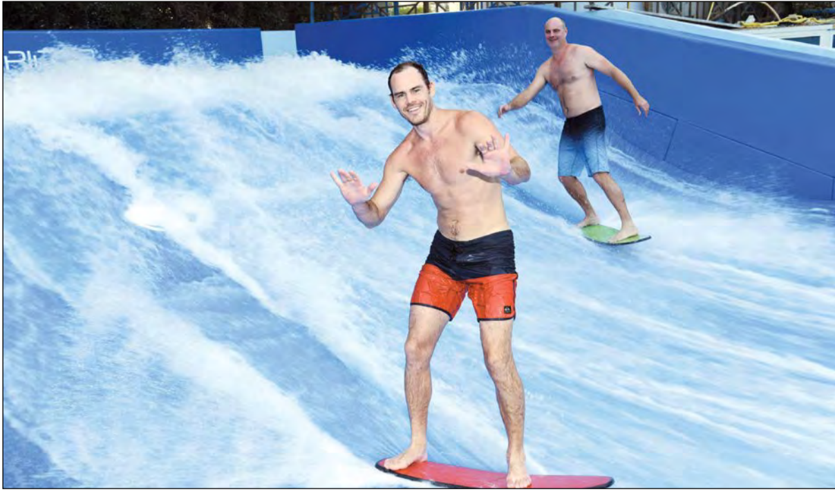
ركوب الأمواج لأول مرة في الكويت.. في (فلو هاوس)