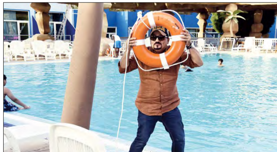
النجار وأجواء من المتعة والاثارة