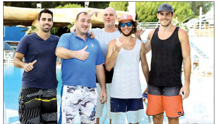
الفريق الأوروبي المنفذ لمشروع ركوب الأمواج