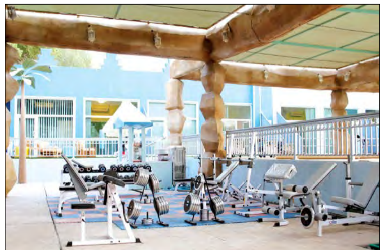
أجهزة رياضية لعشاق الرياضة