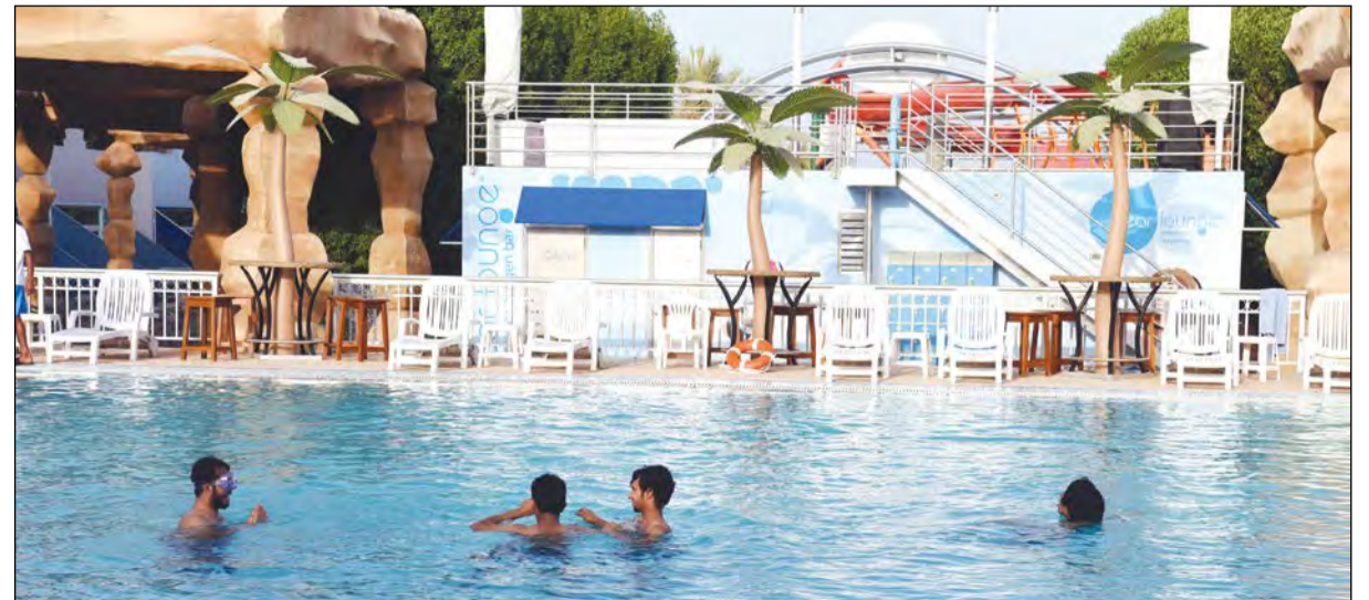
متعة السباحة بعد ركوب الأمواج