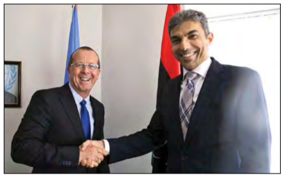
السفير علي الظفيري مصافحا مارتين كويلر

في تصريح لـ«كونا» إن المباحثات التي أجراها مع المبعوث الأممي تناولت التطورات السياسية والأمنية التي تشهدها ليبيا لاسيما نتائج جولة الحوار الأخيرة. وأضاف أن جولة الحوار التي ترأسها المبعوث الأممي كويلر ركزت على سبل تنفيذ (اتفاق الصخيرات) وتشكيل حكومة وفاق موحدة تتولى السلطة في ليبيا بعد نيل ثقة البرلمان وتشكيل جيش موحد لمواجهة التحديات الأمنية.