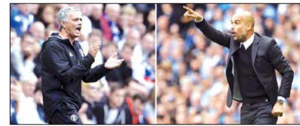
مورينيو وغوارديولا.. صراع من نوع آخر في الدوري