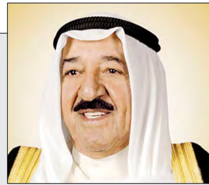
صاحب السمو الأمير الشيخ صباح الأحمد

الأمير نثن تهنئة ولي العهد: التكريم جاء تقديراً لدور وطننا الريادي في المبادرات الإنسانية لإغاثة المنكوبين دون تمييز 22