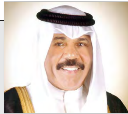
سمو ولي العهد الشيخ نواف الأحمد