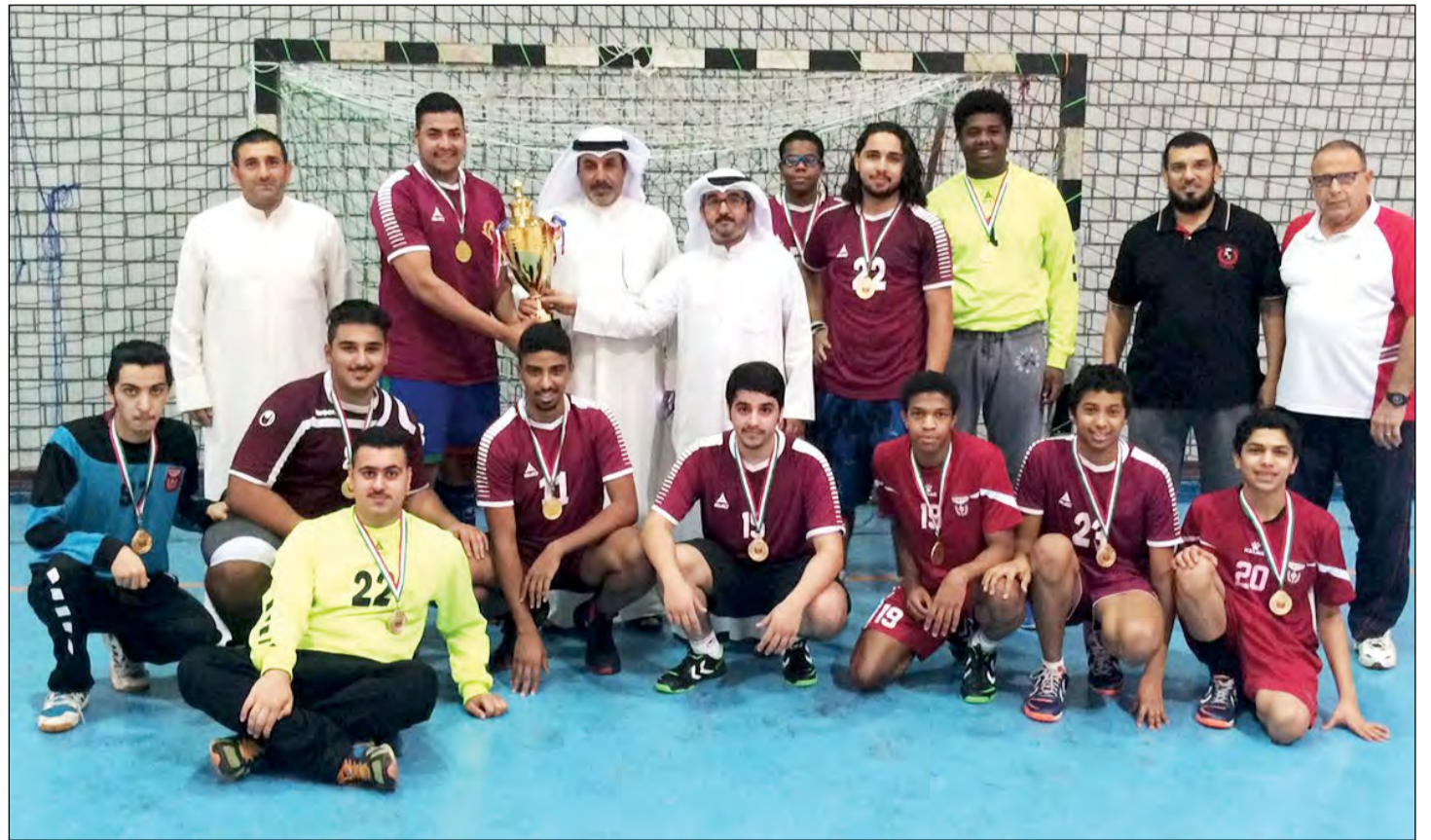
لاعب النصر مع كأس البطولة