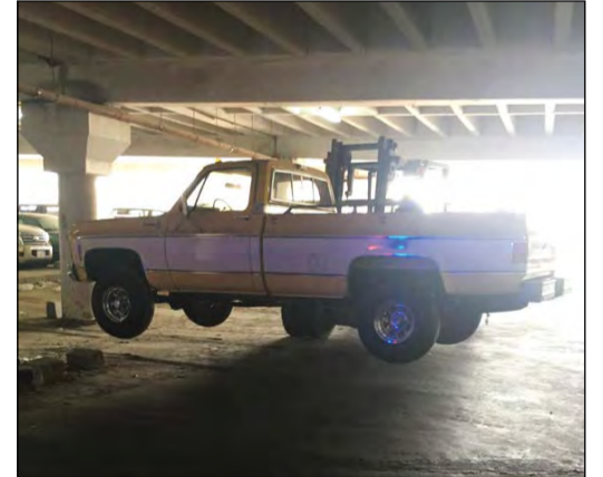
رفع إحدى المركبات المهملة