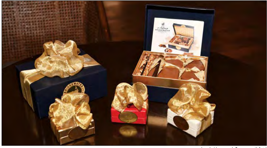
اشكال متنوعة لجميع المناسبات