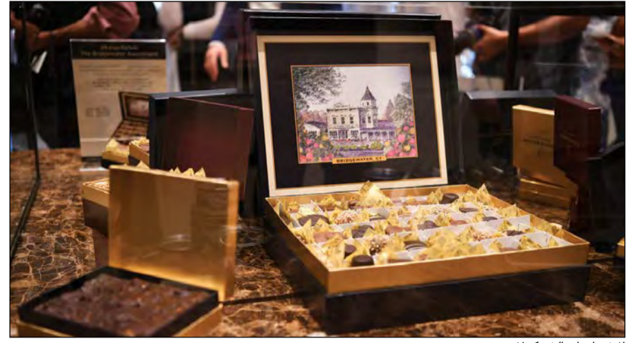
أشكال أنواع الشوكولا