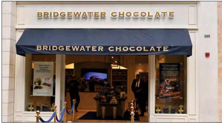
محل «شوكولا بريدج واتر» في غراند أفينوز

● «شوكولا بريدج واتر» لديها فقط 4 فروع في ولاية كونيتيكت الأميركية، وكنا نخطط لافتتاح الفرع الجديد في ولايتي بوسطن أو نيويورك، ولكن رأينا شيئا مختلفا ومميزا لدى شركة محمد حمود الشايح ومدى نجاحه في استقطاب العلامات التجارية العالمية. ونحن لدينا الابتكار ولدى الشايح قوى لوجيستية وترويجية قوية، لذا فكرنا بوضع علامتنا تحت مظلتها، وكما ذكرت نحن لدينا الإبداع والشايح أيضا لديه اللوجستيك والتسويق والمبيعات ممتاز، لذا فإن بذلك العناصر جميعها تكون اكتملت في نجاح المنتج وتوسعه في جميع أنحاء الكويت.