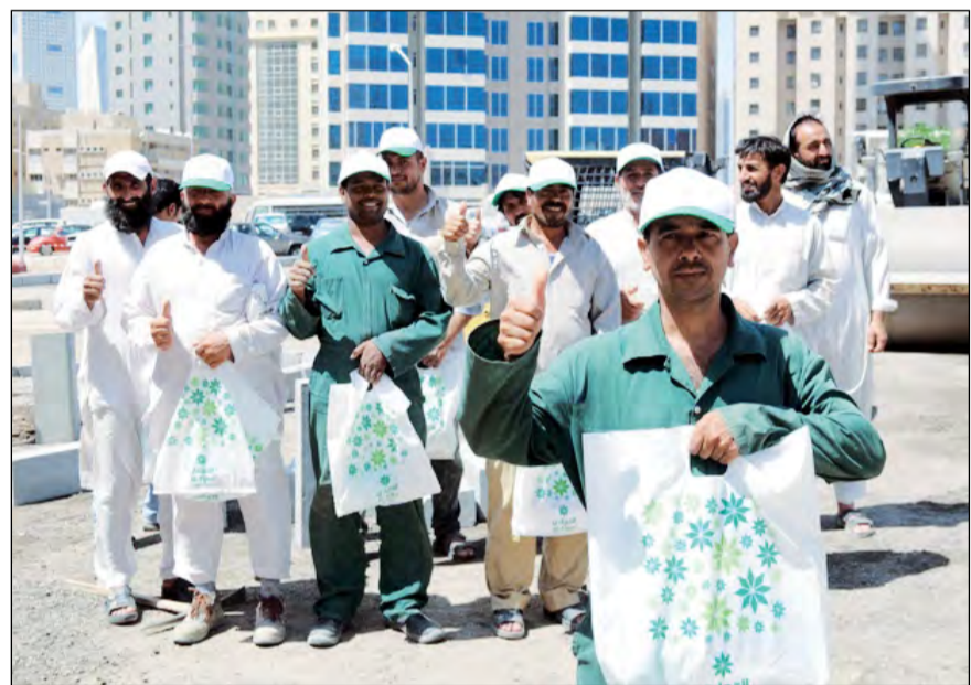
العمال فرحون بالهدايا التي قدمت لهم

كما كشفت الورع أن عدداً كبيراً من عمال النظافة والبناء استفادوا من «هدية العيد»، حيث حصل كل عامل منهم على هديته وهو في غاية