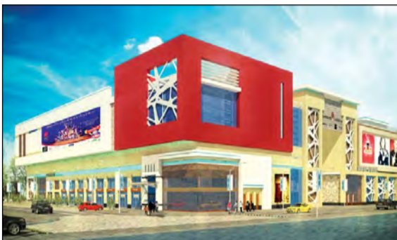
مجمع المخيل في الجفراء

وتسويق وقانوني يتمتع بخبرة عالية، مما ساهم في نجاحها وتميزها في جذب وحيارة ثقة الشركات المحلية والعالمية. من جانب آخر، فإن مجمع «المخيل» المؤلف من أربعة طوابق والذي يمتد على مساحة إجمالية تقارب 16 ألف متر مربع، يشكل واجهة تسوق رئيسية في منطقة الجفراء، حيث يستهدف كل أنشطة البيع بالتجزئة والخدمات ومنها: الملابس والإلكترونيات والمطاعم والمقاهي والأسواق المركزية في تنفيذ وإدارة وتسويق مشاريع المراكز التجارية الكبرى، حيث اكتسبت سمعة محلية إقليمية طيبة عبر عملها وفق أحدث المعايير العالمية المعتمدة في مختلف المجالات، فضلاً عن امتلاكها لفريق هندسي وفني وإداري