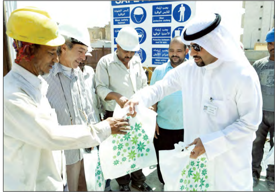
جانب من توزيع العيديات

فسي إطار مساهماته الاجتماعية والخيرية والإنسانية وللعام الخامس، «هدية العيد» لعمال التنظيف والبناء المتواجدين في مواقع عملهم.