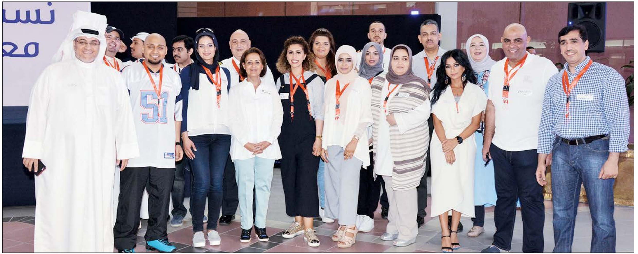
لقطة تذكارية لبعض موظفي الشركة