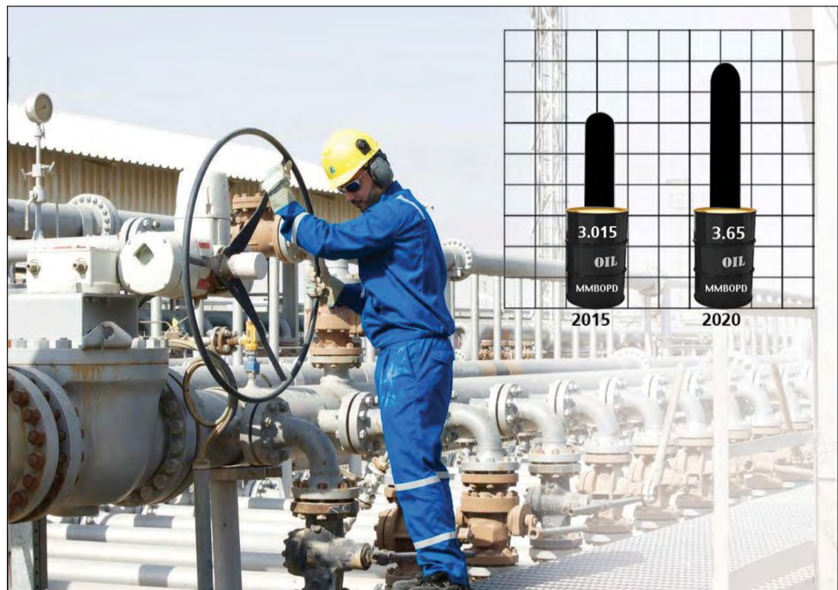
شركة نفط الكويت تنوي رفع إنتاجها 650 ألف برميل يوميا بحلول 2020 علماً أن إنتاجها الحالي عند 3,015 ملايين برميل يوميا.. فهل تنجح في بلوغ المستهدف بنحو 3 سنوات؟

ودفع هذا الوضع التنافسي الشرس بين الدول المنتجة في المنطقة إلى تقديم الكويت خصومات تاريخية لعملائها في السوق الآسيوية، فحسب معلومات لـ «الأنباء» فإن الكويت قدمت خصماً كبيراً في سعر النفط الذي تبيعه إلى آسيا في الشهر الجاري، مقارنة مع سعر نظيره من الخام السعودي والإيراني، وجرى تحديد سعر البيع الرسمي لشحنات الخام الكويتي إلى آسيا عند متوسط خامي عمان وبيي خصوصاً منه 2,65 دولار للبرميل بما يقل 95 سنتاً عن شهر أغسطس والذي تحدد عند 1,70 دولار. وبالعودة لاجتماع النفط،