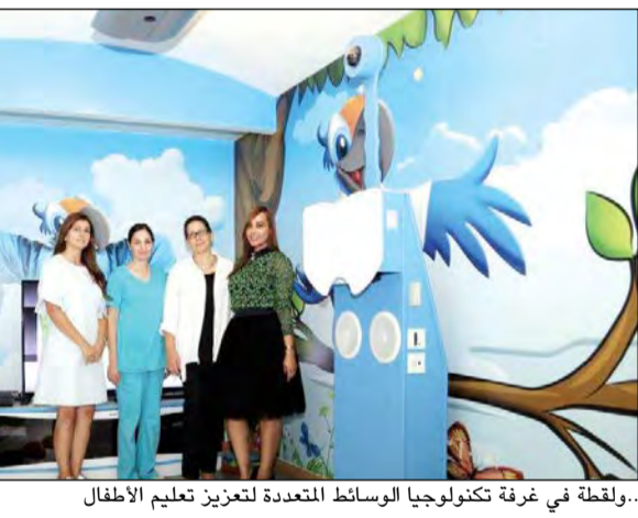
..ولقطة في غرفة تكنولوجيا الوسائط المتعددة لتعزيز تعليم الأطفال

هذا، وتم أيضاً توفير أجهزة حاسبات لوحية من أجل مساعدة المعالجين والأطباء النفسيين على تشجيع وإشراك الأطفال في الأنشطة المختلفة، كما إنها أداة مفيدة للاهتمام وتعزيز بيئة علاجية إيجابية