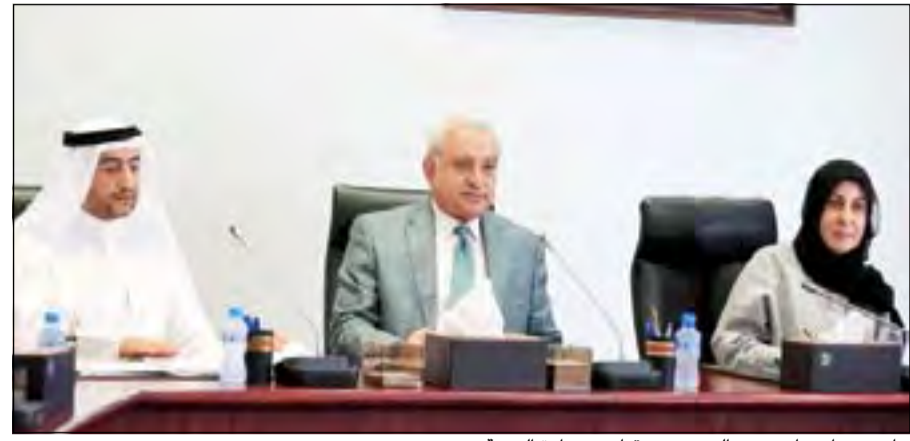
جانب من اجتماع د.بدر العيسى مع قياديي وزارة التربية

وأضاف أنه بعد تسلم تقارير المناطق التعليمية وبحسب قراءتنا للتقارير فإن كثير من الأعمال أنجزت ولكن من خلال زيارتنا أمس وأول أمس لاحظنا أن بعض المدارس فيها نواقص فابلغنا مديري المناطق بذلك وكلفناهم بمتابعة هذه الأمور.